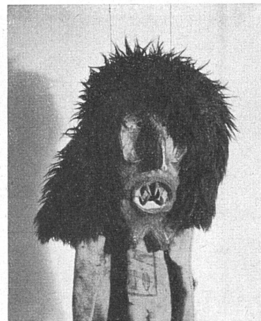
Lötschentaler Maske. Musée de l'Homme, Paris

Die Galerie Daber veranstaltete eine sehr harmonisch gruppierte Corot-Ausstellung. Das Prachtstück dieser Ausstellung ist das Selbstporträt, das der Künstler in seinem Todesjahre 1875 den Uffizien in Florenz vermachte. Die übrigen meist kleinformatigen Bilder stammen hauptsächlich aus Pariser Privatbesitz. Der köstliche «Quai des Paquis à Genève» wurde vom Genfer Musée d'Art et d'Histoire ausgeliehen. Im Musée de l'Homme wurde die Abteilung «Europa» neu eröffnet. Diese kurz vor dem Kriege geschaffene Sektion führt uns mit konzentrierten Beispielen in die Volkskunst Europas ein. Die schweizerische Gruppe zeigt hauptsächlich Dokumente und Trachten, ferner insbesondere einige hervorragende Masken aus dem Lötschental.