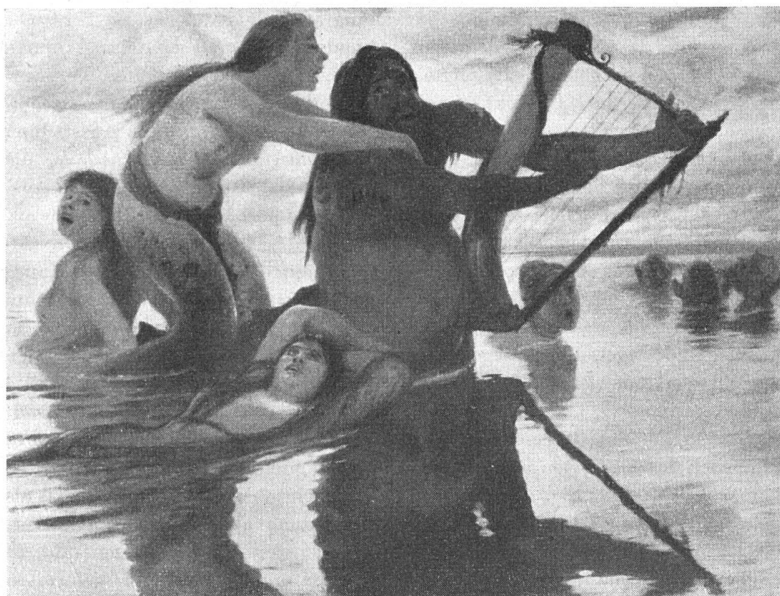
Arnold Böcklin, Im Meere (Seetingellangel) , 1884. Privatbesitz Basel

So gesehen, ist Böcklin heute für uns der vielleicht lebendigste und mit all seiner naiven Subjektivität auch der sprechendste Zeuge der zweiten Hälfte des 19. Jahrhunderts: der deutschen Spätromantik, der deutschen Italiensehnsucht und der daraus resultierenden neuen Erforschung antiker und italienischer Kunst und Kultur durch Jacob Burckhardt und Heinrich Wölfflin.