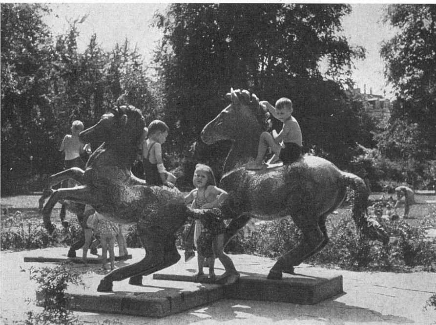
Spielplastiken von Rudolf Wening. Kinderspielplatz Bäckeranlage, Zürich. Gartenbauamt der Stadt Zürich | Sculpture de jeu de Rudolf Wening. Place de jeu pour enfants à Zurich | Play ground sculptures by Rudolf Wening. Children's play ground, Bäckerpark, Zurich