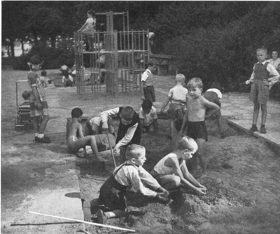
Kinderspielplatz, Margarethenpark, Basel. Stadtgärtnerei Basel | Emplacement de jeu pour enfants; Margarethenparc Bâle | Children's playground, Margarethen Park, Basle