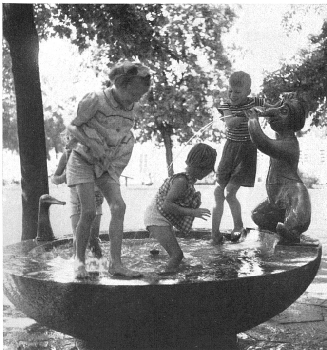
Spielbrunnen «Zwerg Nase» von Heinz Fiorese. St. Johann-Anlage, Basel. Stadtgärtnerei Basel | Fontaine de jeu de Heinz Fiorese. Parc de St-Jean, Bâle | Play ground fountain by Heinz Fiorese. St. Johann Park, Basle