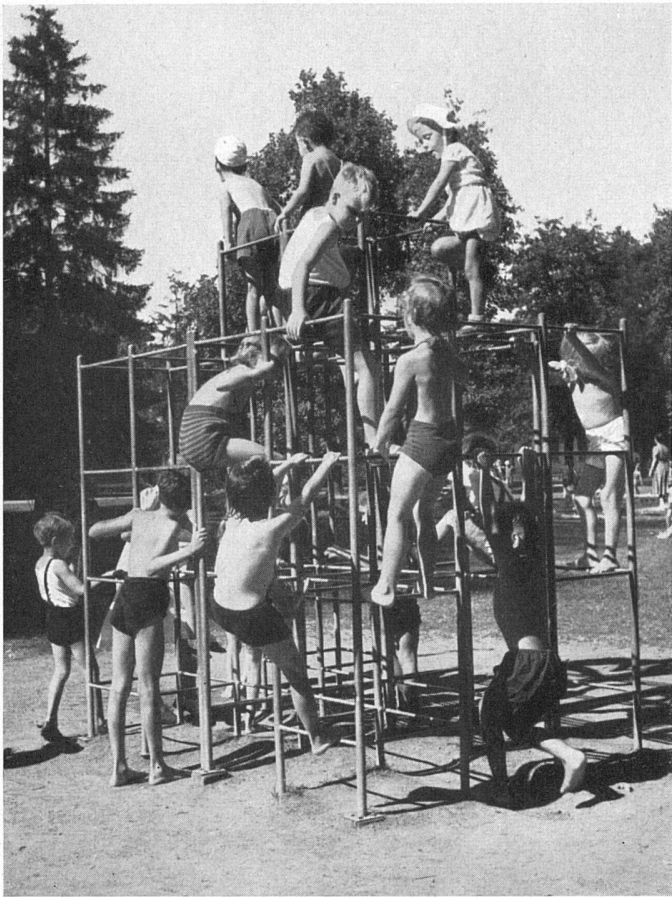
Kletterturm, Schützenmattpark Basel. Stadtgärtnerei Basel | Engin à grimper. Parc de Schützenmatt, Bâle | Climbing tower, Schützenmatt Park, Basle