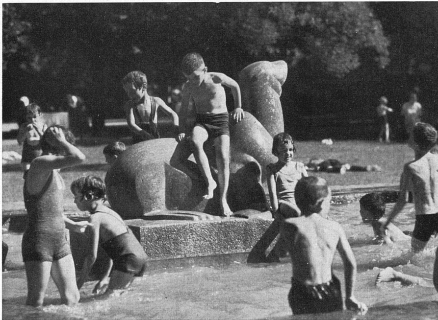
Planschbecken mit Spielplastik von Louis Weber. Schützenmattpark, Basel. Stadtgärtnerei Basel | Bassin avec sculpture de jeu de Louis Weber. Parc de Schützenmatt, Bâle | Paddling pool with play ground sculpture by Louis Weber. Schützenmatt Park, Basle