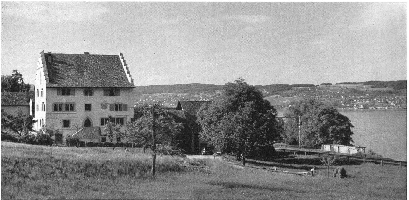
Gesamtansicht mit See von Süden | Vue générale prise du sud | General view from south with Lake of Zurich