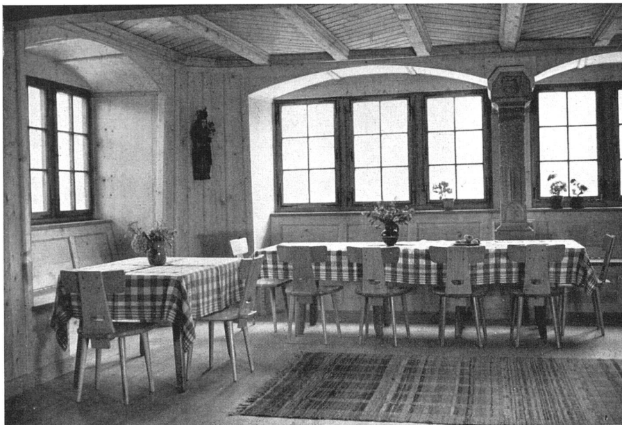
Wohn- und Eßstube | Salle commune | Living- and dining-room