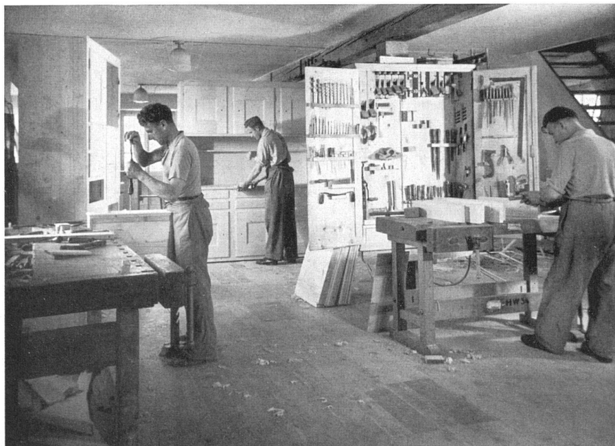
Schreinerei | Atelier de menuiserie | Joinery workshop