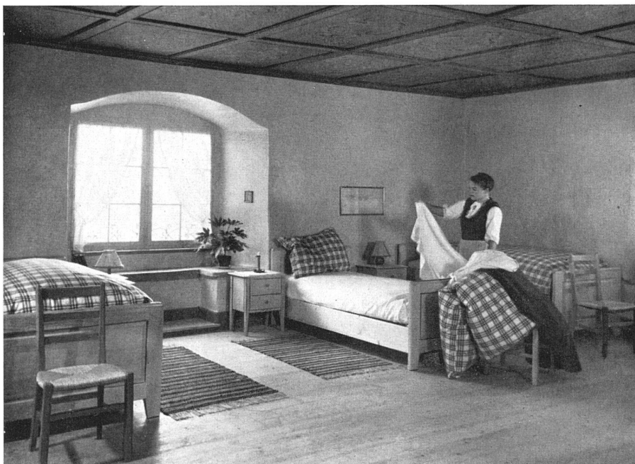
Schlafräum der Schüler | Chambre à coucher d'élèves | Students' bedroom