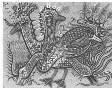
Vandersteen, Canard cinq-têtes. Galerie Hutter, Basel.

Eine scheinbare Paradoxie: «Wir wollen die Museen und Bibliotheken zerstören! Museen – Kirchhöfe!» verkündete Marinetti im ersten futuristischen Manifest des Jahres 1909. Heute räumt das Kunsthhaus seine musealen Räume aus und öffnet sie einer umfassenden Darstellung dieser Kunstströmung, die wie ein Gewitter in die Jahre vor dem ersten Weltkrieg gefah-