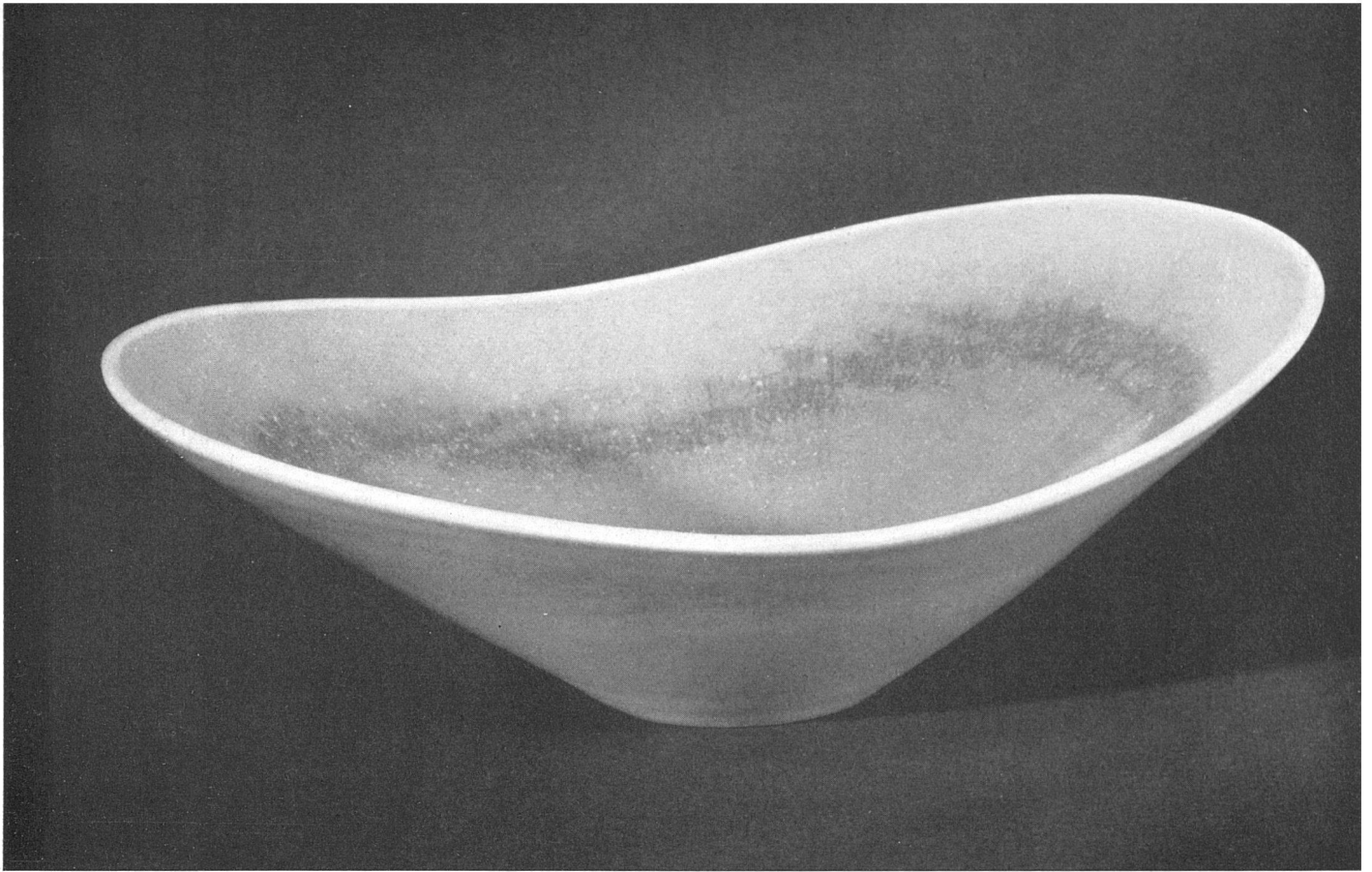
Stig Lindberg, Kleine Steingutschale | Petite coupe en faïence | Little bowl in stoneware. (AB Gustavsbergs Fabriker, «Gustavsbergs Studio»)