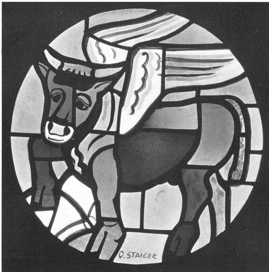
Otto Staiger, Symbol des Evangelisten Lukas. Glasgemälde in der katholischen Kirche Liestal / Symbole de l'évangéliste St Luc. Vitrail. Eglise catholique de Liestal | Symbol of Saint Luke the Evangelist. Stained glass window in the Catholic Church of Liestal