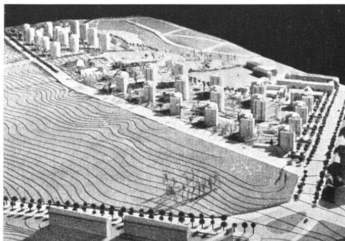
Dänischer Vorschlag für Turmhaussiedlung. Die zu große Wiederholung desselben Bautypes führt zu Einförmigkeit | Projet danois pour des «tours d'habitation». L'emploi trop répété du même type de bâtiment engendre la monotonie | Danish project for «apartment towers». The frequent repetition of the same building type results in monotony

Diese Gefahr kann jedenfalls durch den dem Leben eher entsprechenden vielgestaltigen Quartieraufbau gebannt werden. Es kann eine Einheit höherer Ordnung, beruhend auf Wechselwirkung und Ausgleich der architektonischen Elemente geschaffen werden.