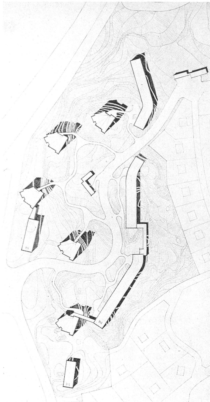
Situationsplan 1:2500. 7-geschossige Turmhäuser und 3-geschossiger Zeilenbau mit verschiedenen sozialen Bauten. Beispiel für organische Eingliederung ins Gelände und gute räumliche Lösung | Tours de 7 étages, rangées à 3 étages et différents bâtiments pour services communs. Exemple de bonne adaptation au terrain et d'une excellente solution spatiale | Seven-story towers, three-story terraced housing and several buildings for common services. Example of a good adaptation to the site and a successful spatial solution.

Vielgeschossige Mietshäuser können nicht an beliebigen Orten erstellt werden und sind auch nur im Rahmen großer Überbauungen möglich. Sie müssen entsprechend ihrer hervortretenden Erscheinung äußerst sorgfältig städtebaulich eingeordnet und architektonisch durchgebildet sein.