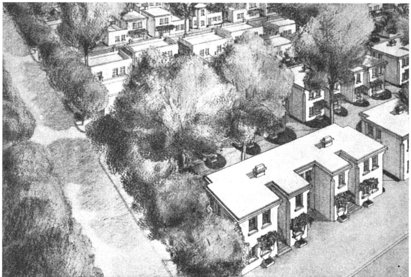
Wohnviertel der «Cité industrielle». Architekt Tony Garnier