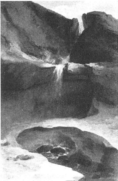
Caspar Wolf, Wasserfall und alter Schnee. Um 1775. Stiftung Dr. Oskar Reinhart, Winterthur

die konkave Form, alles Gehöhlte, Trichterförmige, sich Einziehende zu betonen, so daß die rokokohafte Vorliebe für alles Kurvige wie eine ganz persönliche triebhafte Präokupation Wolfs erscheint. Nicht umsonst wurde er schon früh der «Höhlenwolf» genannt.