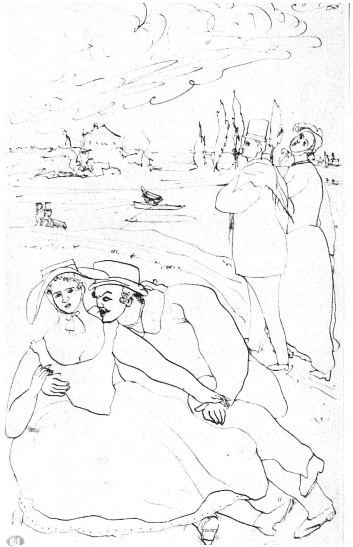
Ernst Josephson, Promenade , Zeichnung. Nationalmuseum, Stockholm | Promenade , dessin | Promenade , drawing

Hochzüchtung nicht ersetzen. Man kann nicht als Klassiker anfangen.