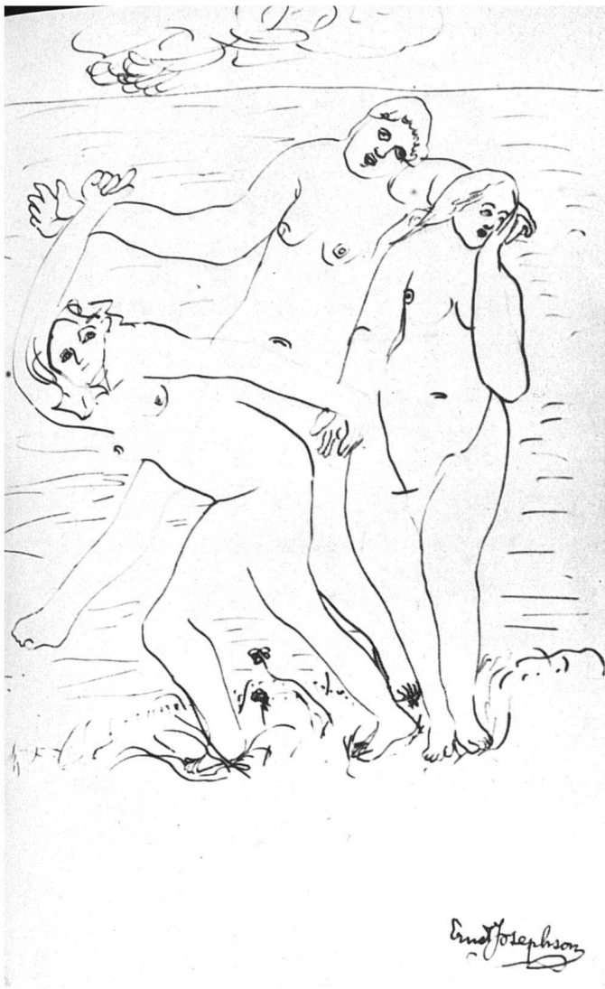
Ernst Josephson, Die Tanzenden am Strand , Zeichnung. Nationalmuseum, Stockholm | Danseuses sur la plage , dessin | The Dancers on the Beach , drawing