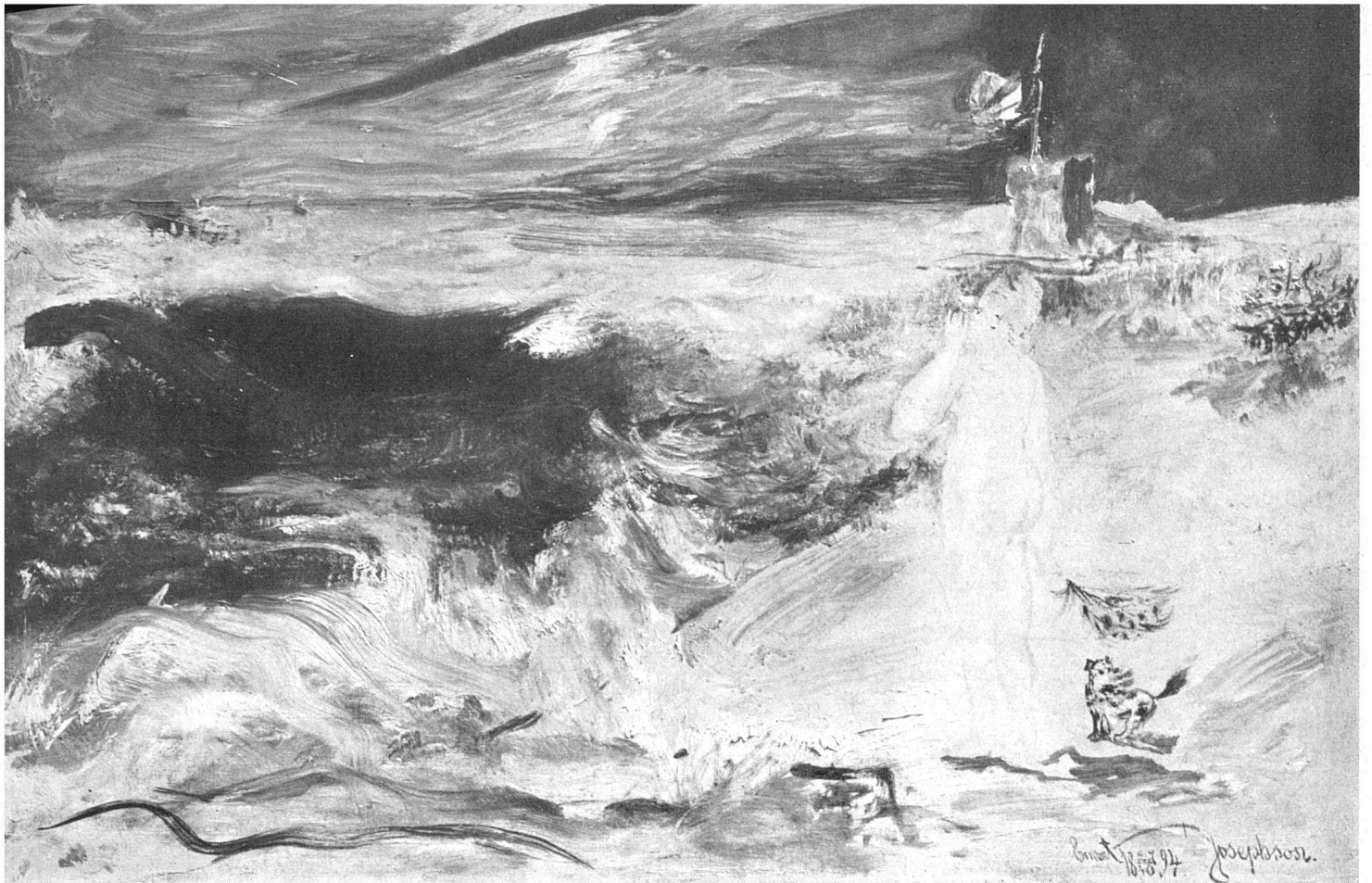
Ernst Josephson, Stürmische See , 1894 / Mer orageuse / Stormy Sea