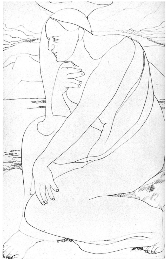
Ernst Josephson, Meditation , Zeichnung. Nationalmuseum, Stockholm | Méditation , dessin | Meditation , drawing

Schweden des Biedermeier in den Weg stellte, im Unverständnis für seine großen Ambitionen, in den Mißerfolgen vor Kritik und Publikum, im Verrat der Kameraden. Dazu kamen Schwierigkeiten persönlicher Art: eine unglückliche Liebe, tiefe Einsamkeit und Not. Selbst diejenigen, die ihn anfangs gefördert hatten, versagten ihm schließlich ihre Hilfe. Die Verzweiflung Josephsons über diese Lage klingt uns aus seinen Briefen und Gedichten entgegen. Die größte Aufmerksamkeit bei der Beurteilung seines Falles müssen wir dem Dämon seines Kunstwillens schenken, der ihn einmal ausrufen ließ: Flieg höher, höher – so daß dich keine Kleinvögel mehr erreichen können!