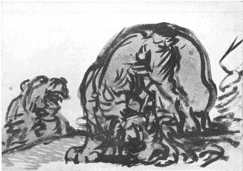
Alexander Cozens, Tiger. Pinselzeichnung

Mit den Aquarellmalern des 18. und 19. Jahrhunderts gewinnt die englische Kunst, die sich zuvor in Sir Joshua Reynolds und in Gainsborough auf das nationale, bürgerlich-aristokratische Porträt konzentriert hatte, europäische Bedeutung. Ein ganzes