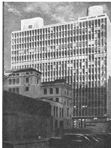
Ministerium für Hygiene und Erziehung in Rio de Janeiro. Architekten L. Costa, O. Niemeyer, A. Reidy, C. Leao, J. Moreira, E. Vasconcelos, Consult. Arch.: Le Corbusier

Der Verfasser schreibt: «In gewisser Hinsicht sind die neuesten modernen Bauten Brasiliens für den Stand der modernen Architekturentwicklung bezeichnender als etwa die Vorkriegsbauten aus der Schweiz, Tschechoslowakei und aus Schweden, denn wenn sich auch die neuen Auffassungen in diesem Lande später als in jenen Ländern verbreiteten, so wurden sie mit einer um so eindrucksvolleren und selbstbewußteren Bravour aufgegriffen und, von einem allgemeinen sozialen und politischen Auftrieb getragen, in die Wirklichkeit umgesetzt. Die brasilianischen Architekten haben die moderne Bauentwicklung in rascher Folge in einer frischen und mutigen Weise zu einer breiten Entfaltung gebracht, wobei sie allerdings das Glück hatten, mit einer weitgehenden öffentlich-staatlichen Anerkennung und Unterstützung rechnen zu können. Die Regierung Vargas scheint die fortschrittlich gesinnte neue Generation tatkräftig zu fördern und zur Lösung bedeutender öffentlicher Bauaufgaben heranzuziehen. Sie anerkennt ferner willig eine Be-