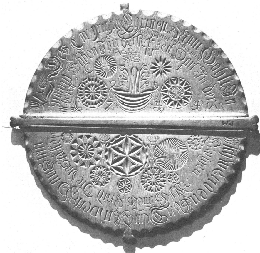
Abb. 7 Käsedeckel mit Kerbschnitzerei Diemtigtal 1744

Daß der Volkskunst ein Anrecht auf autonome wissenschaftliche Behandlung zukommt, dürfte nach den Untersuchungen Freyers nicht mehr bestritten werden können. Der Vorwurf einer «ästhetisierenden, modisch gefärbten Betrachtung», den Dr. Fritz Gysin im letzten Jahresbericht des schweizerischen Landesmuseums erhebt, ist nicht gerechtfertigt und verkennt die Tatsachen. Die schweizerische Volkskunst ist nicht eine Manifestation nur «untergeschichtlicher» Lebensformen und als solche der individuellen und bewußten Formung in schroffem Gegensatz gegenübergestellt. Gerade ihre eigenartige Zwischenlage, ihr Transzendieren in andere Bereiche macht sie für die Forschung so reizvoll und interessant.