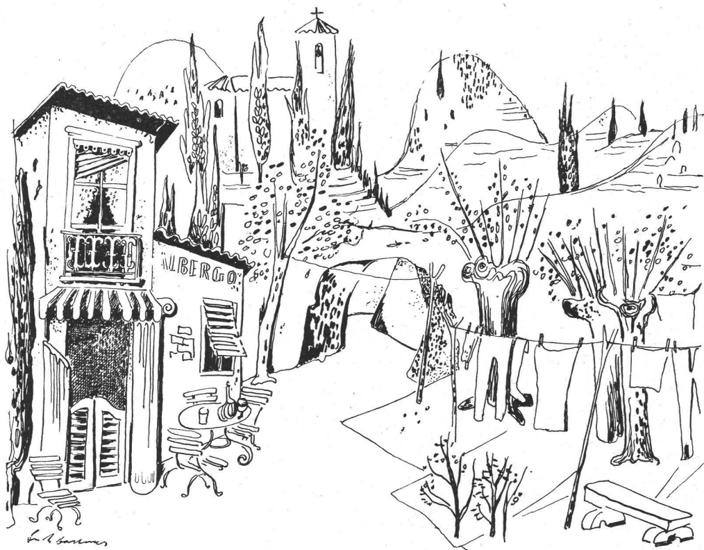
Max Sulzbachner SWB, Basel Bühnenbilder für das Stadttheater Basel zu Fra Diavolo von Auber

Um einen schnellen Umbau zu erreichen, sind die Bilder verschieden, bei gleichbleibender Unterkonstruktion, wie aus den untenstehenden Skizzen ersichtlich.