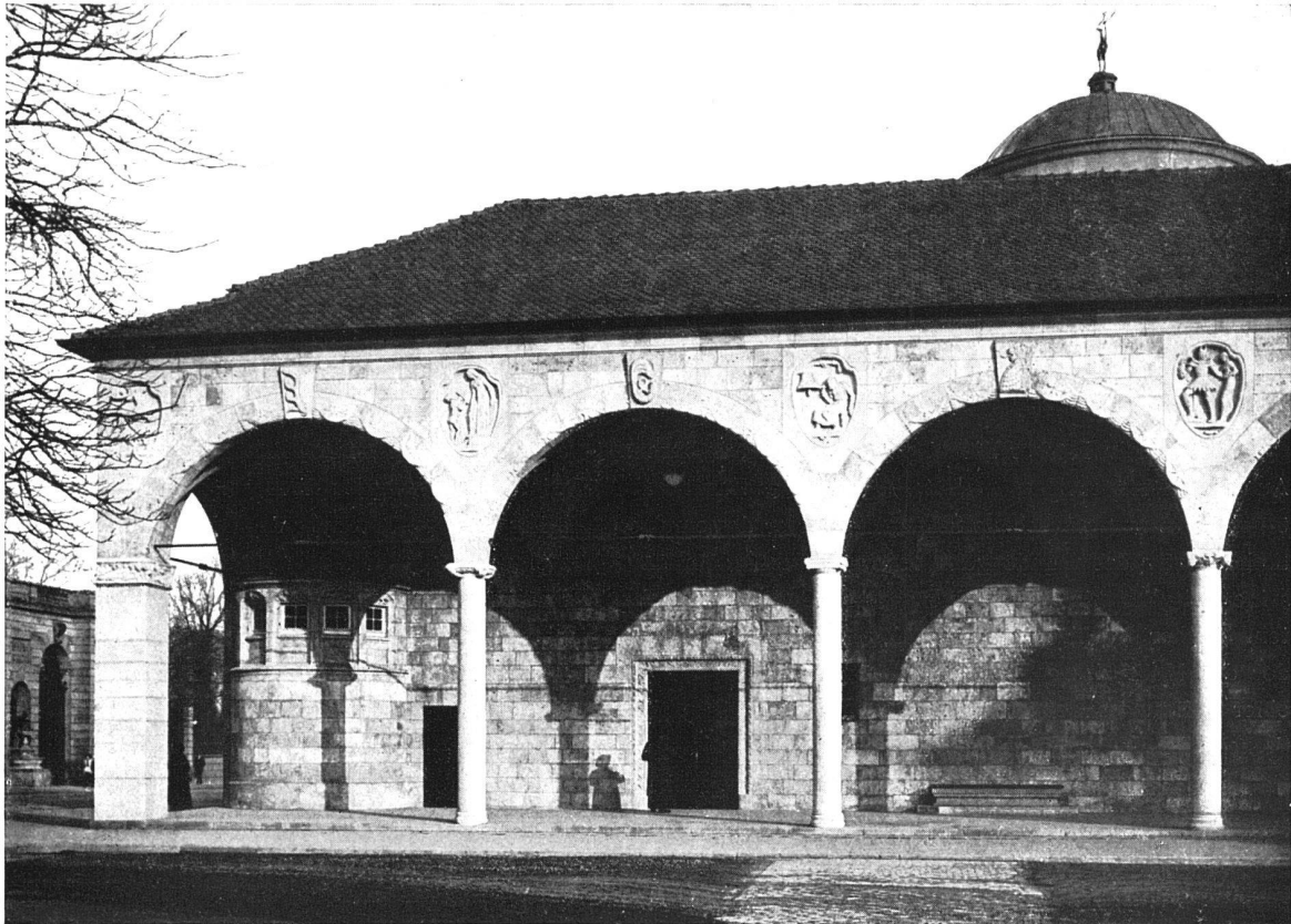
Theodor Fischer, München, 1862–1938. Die Vorhalle des Kunstgebäudes Stuttgart, vollendet 1912

Die proportionale Spannung war im Aesthetischen stets Fischers Hauptanliegen — durch sie ist noch die gleichgültigste Hinterseite seiner Bauten auf den ersten Blick als seine Arbeit erkennbar. Nie sind die Verhältnisse lahm, zufällig, verschieblich oder starr schematisch. Wie etwa ein Einzelfenster in einer gegebenen Wandfläche sitzt, wie es mit anderen Oeffnungsgruppen in Relation gesetzt ist, ist stets das Ergebnis eines präzisen, ästhetisch-intellektuellen Kalküls. Der bayrische Neubarock wie jeder «Heimatschutzstil» liess es gern auf gemütliche Zufälle im Zusammenspiel seiner vielen Motive ankommen — das konnte an anspruchslosen Bauten nett sein, aber es war nie «grosse Architektur». Fischers Bauten sind nie in diesem misslichen Sinn «gemütlich», ihr ästhetisches Kalkül ist bis ins letzte bereinigt, sie sind ungleich wacher, strenger, gerade auch da, wo sie Ornamente und «Motive» verwenden. Gewiss war der süddeutsche Gefühlsüberschwang auch für Fischer eine ständige Gefahr, aber er ist ihr nie erlegen. Seine Bauten sind gemütvoll, aber nie sentimental; das Ornament ist reich, aber nie üppig; warm, aber nie schwül, man möchte sagen, es ist protestantisch-, nie katholisch-barock. Fischer suchte sich übrigens auch theoretisch über die Proportionsbeziehungen klar zu werden. Er hat selbst Proportionsstudien betrieben und an denen