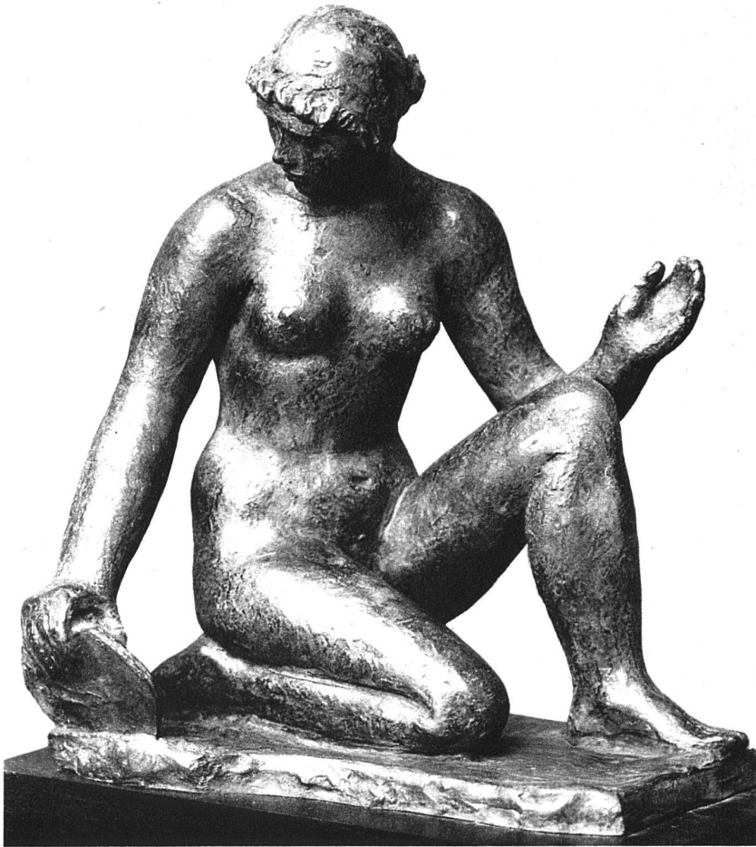
«Mädchen mit Spiegel» Bronze, 26 cm hoch, 1933

reit zur Kritik, er gab sich nicht mit der ersten Idee zufrieden, und mehrere Male hat er im Wunsch, das Beste und Letzte zu geben, preisgekrönte Entwürfe völlig umgearbeitet.