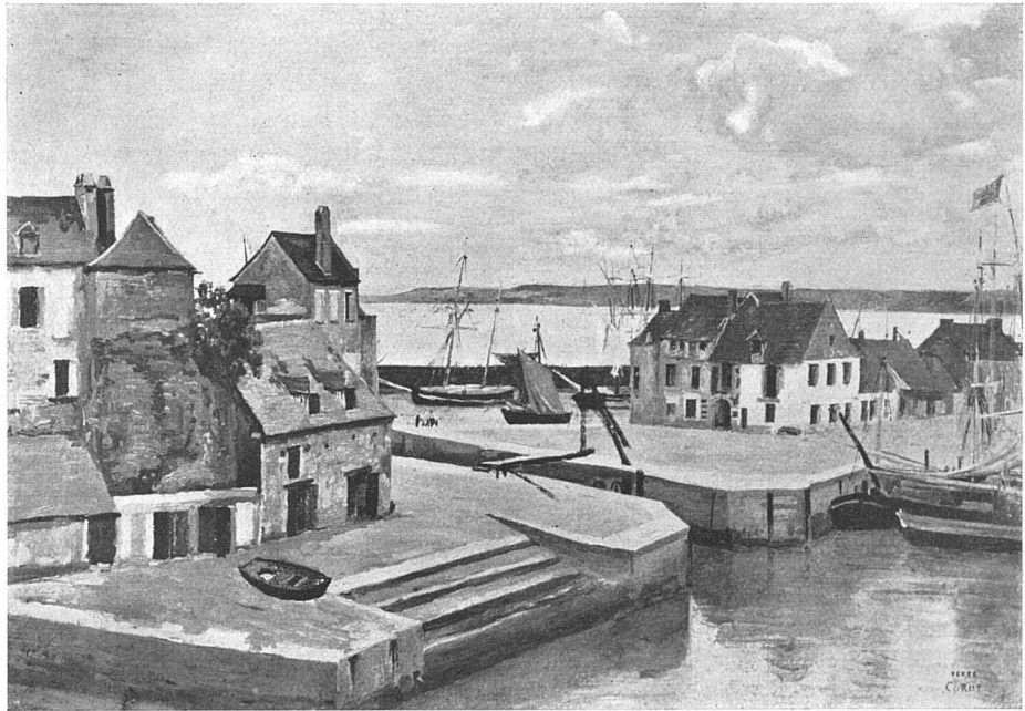
55 × 38, Sammlung E. Staub-Terlinden, Männedorf (Kt. Zürich) (Robaut 223)

die Bilder von Mantes, auf denen sich Landschaft und Architektur mit naturhafter Selbstverständlichkeit verbinden. Was Corot in der Zeit der schummrigen Grautöne, der verwehten Baumkronen, der elegischen Uferlyrik gemalt hat, wurde mit Recht mehr in studienartigen und naturnahen als in den ausgeführten poetischen Arbeiten vorgeführt, und die aus dem Louvre stammenden Gemälde, die nach 1870 entstanden sind, zeigten die Kunst des mehr als 74jährigen in einer herrlichen Gelöstheit, die unmittelbar auf die damals jungen und allem