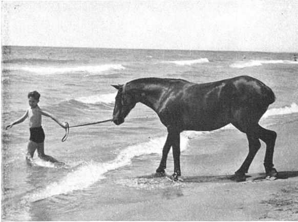
I. Preis für die schönste Tieraufnahme: Hans Los , Zürich Klare, graphische Wirkung; drei Haupttöne weiss, grau, schwarz Der schöne Kontrast der bewegten dunklen Massen zum ruhigen Horizont wird belebt durch die weissen Schaumkronen Natürliche, nicht künstlich gestellte Szene