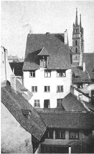
I. Preis für die schönste Aufnahme eigener Wahl: W. Wetter, Zürich

Eines der vielen kleinen Bilder, die auf den ersten Blick unscheinbar wirken, aber ein intimes Verständnis für das Wesentliche und für Standort und Begrenzung des Motivs zeigen. Hervorragend saubere Wirkung ohne gesuchte Effekte. Eine bei solchen Wettbewerben seltene, sehr sympathische Art von Aufnahmen.