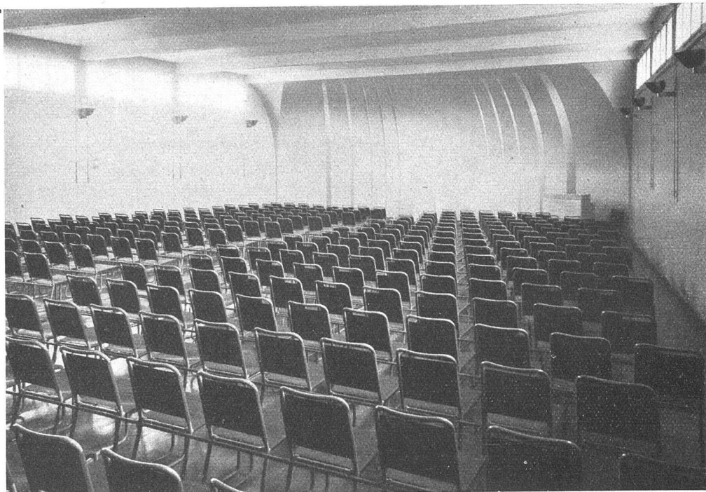
Markuskapelle Hirzbrunnen, Basel / Bigla-Stahlrohrbestuhlung