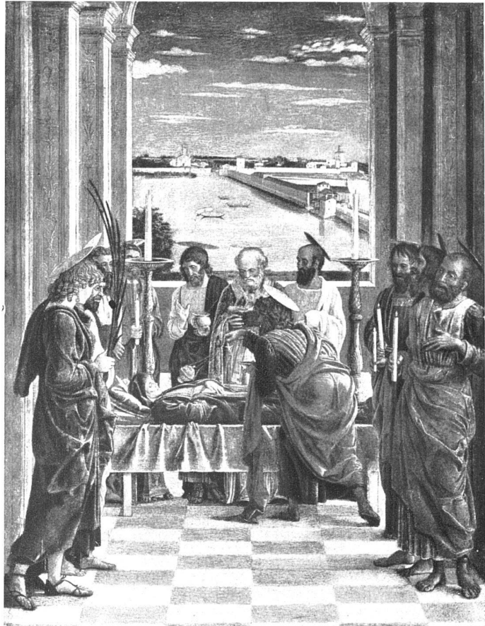
Mantegna, Tod der Maria (Madrid)

begegnet Wölfflins Buch, soweit ihm nur immer begegnet werden kann. Es wendet den Gegenstand seiner Betrachtung sozusagen in der Hand, um seine Fassetten von allen Seiten spiegeln zu lassen, und die Darstellung bekommt dadurch etwas eigentümlich Schwebendes, weil immer wieder sich eines im andern spiegelt, Späteres sich im Vorangegangenen erläutert und umgekehrt, bis sich alle Spannungen in der Durchsichtigkeit einer in sich selber ruhenden Erkenntnis aufheben.