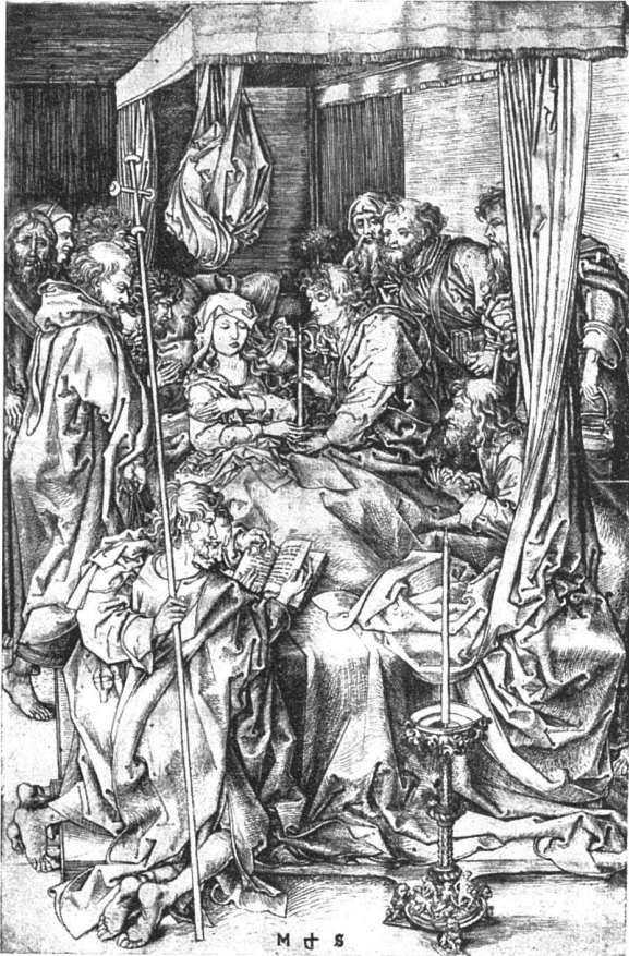
Aus H. Wölfflin «Italien und das deutsche Formgefühl