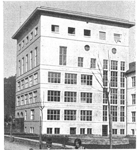
Thun, Neubau des Gymnasiums Ernst Balmer, Architekt BSA, Bern

Und nun noch eine kleine tragikomische Sache. In Bern an der Marktgasse wird durch die Architekten Trach-