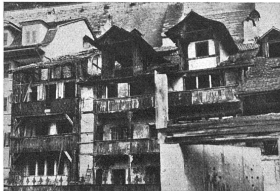
Die Badgasse am Fuss der Berner Münsterterrasse vor der Sanierung

Das Protektorat der Ausstellung übernahm Oberbürgermeister Dr. h. c. Adenauer.