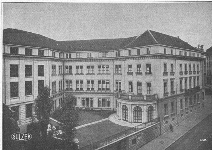
Basler Handelsbank, Basel. Sulzer-Pumpen-Warmwasserheizungs- und Ventilationsanlage; ausgeführt durch A.-G. Stehle & Gutknecht, Sulzer-Zentralheizungen, Basel.