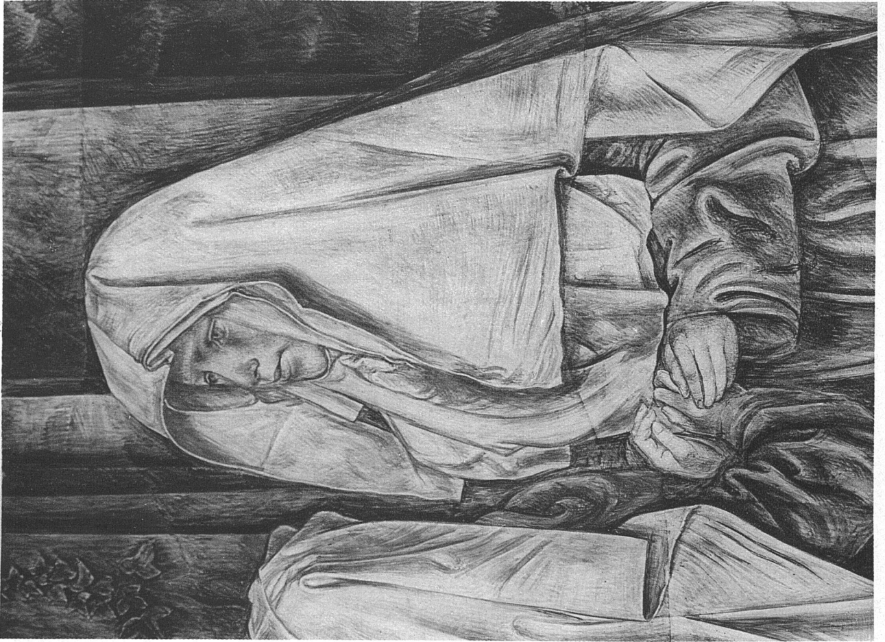
PAUL BODMER / FRESKEN IM FRAUMÜNSTER-DURCHGANG, ZÜRICH