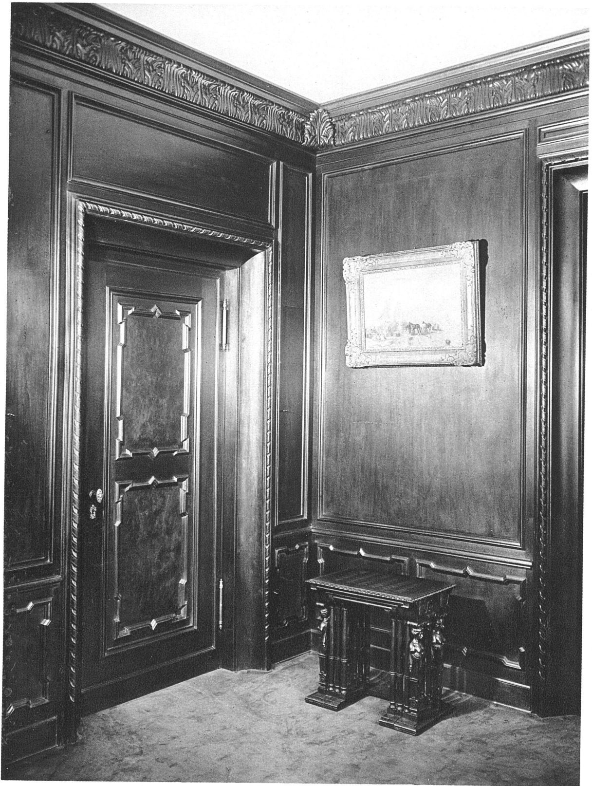
Intérieur aus einer Villa in Zürich