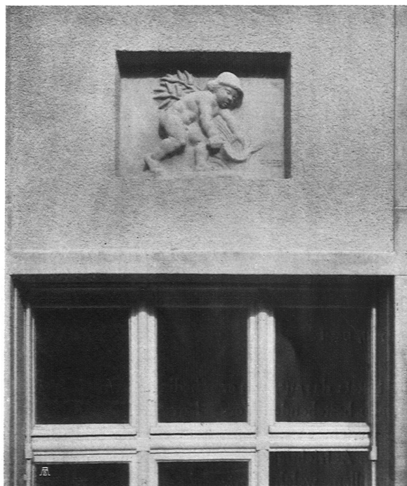
Motiv von der Frauenarbeitsschule in Basel

nach dem tiefer gelegenen Stadtteil mit großen Treppenanlagen durchgeführt sein wird, wird erst die Baumasse richtig zur beabsichtigten Wirkung kommen, die man heute trotz der bevorzugten Lage mehr erahnen muß, wie auch der photographische Apparat den Bau in seiner richtigen Wirkung nicht wiedergeben kann, so dass wir für den Gesamteindruck der architektonischen Leistung auf die gezeichnete Fassade verweisen müssen. Eine reichere Ausgestaltung hat einzig der Haupteingang erfahren, während sonst lediglich kleine plastische aber gut wirkende Zierstücke die Fassaden beleben. Der vorzüglich disponierte Grundriss erlaubte eine praktische Anordnung der Räumlichkeiten, bei deren innerer Ausgestaltung der Farbe als belebendes und schmückendes Element eine wichtige Rolle zugeteilt wurde. So ist bei aller notwendigen Einfachheit ein freundlicher und wohnlicher Eindruck erzielt worden in den Lehrzimmern und in den übrigen Räumlichkeiten. Die Detailaufnahme des Mittelstückes am Bungebrunnen, der als Denkmal für den berühmten Basler Gelehrten gedacht ist, zeigt, mit welchem künstlerischem Gefühl Bernoulli derartige Aufgaben architektonisch zu lösen versteht. Denkmal, Brunnenanlage und Umgebung bilden eine zusammengehörige Einheit von feierlicher und doch schmuckvoll freundlicher Wirkung.