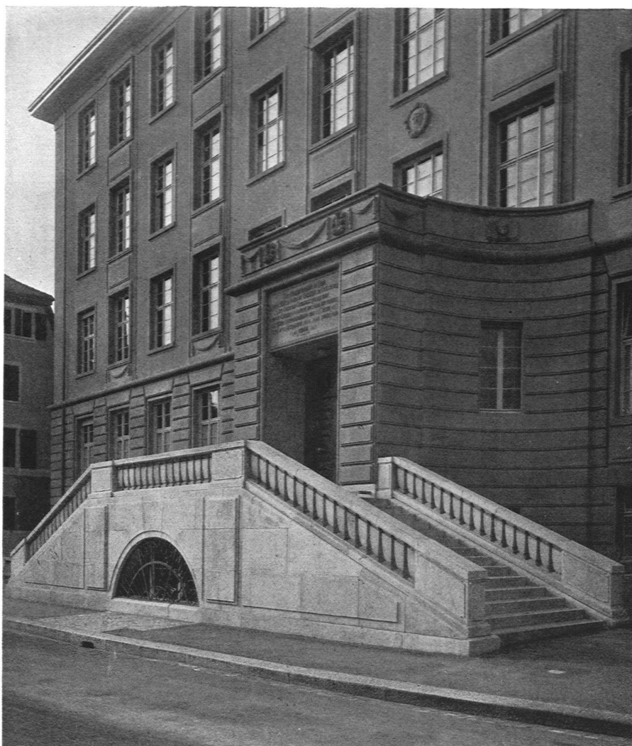
Frauenarbeitsschule in Basel