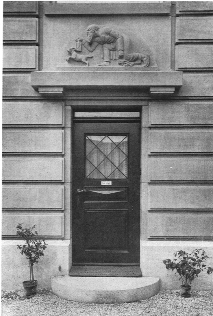
Frauenarbeitsschule in Basel