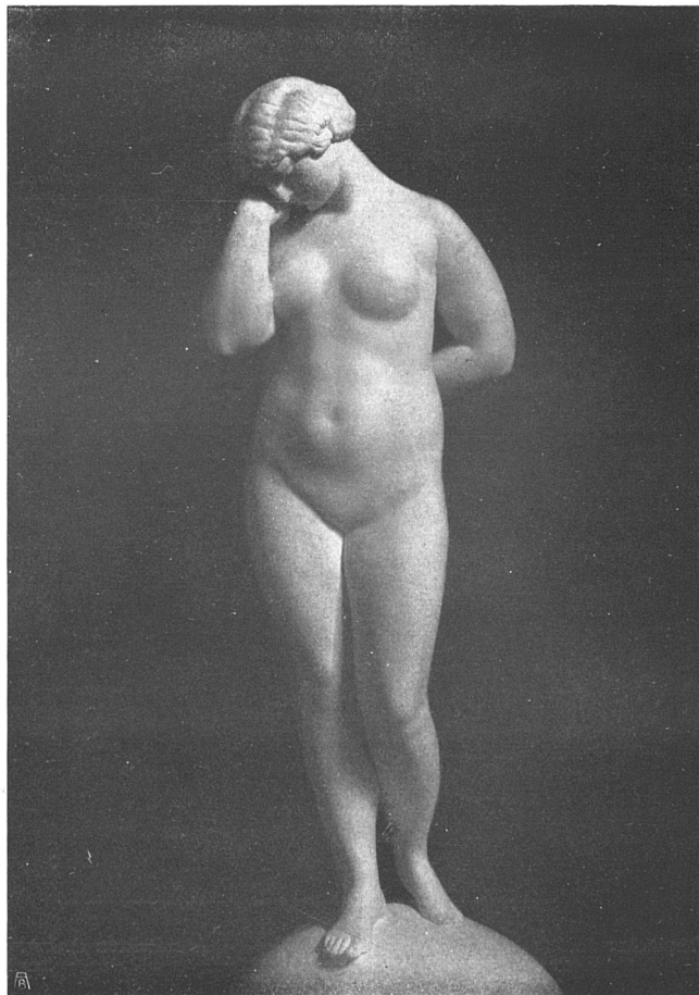
Stein und Bronze Figur unten: in Marmor