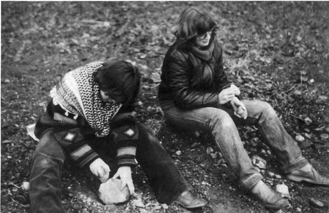
Zwei Mädchen schlagen Feuersteinwerkzeuge auf einem Unterlagsstein oder Amboss (links) und in der freien Hand (rechts).