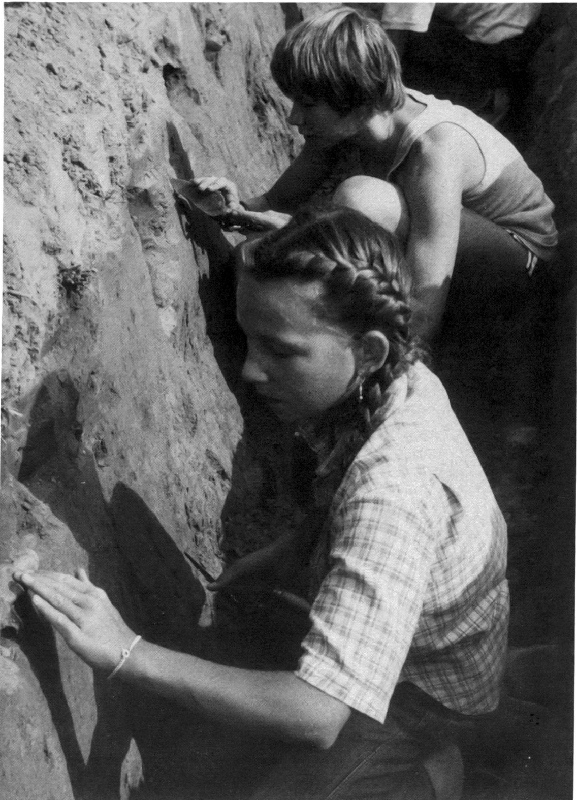
Schüler erleben Geschichte mit den Händen und Augen. Sondiergrabung uf Wigg bei Zeiningen im Herbst 1981.