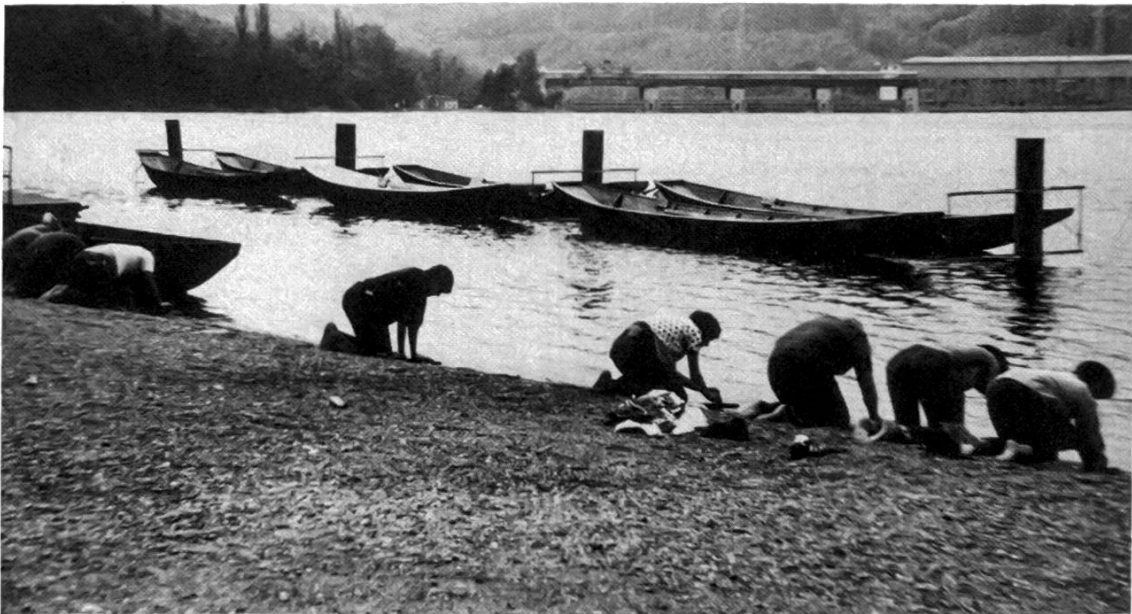
Geschichtliches Praktikum im Frühsommer 1980. Die Schüler schleifen auf einem Sandstein eine Steinbeilklinge, um sie in einem späteren Arbeitsgang in einem Holzstiel zu schäften und damit zu arbeiten.

Dieser Rückblick auf ein geschichtliches Praktikum regt vielleicht zu eigenen Versuchen an. Aus persönlichen Erfahrungen – durch Höhepunkte, Enttäuschungen und Freuden – kann aber der Wert solchen Tuns und Lassens erst abgeschätzt werden.