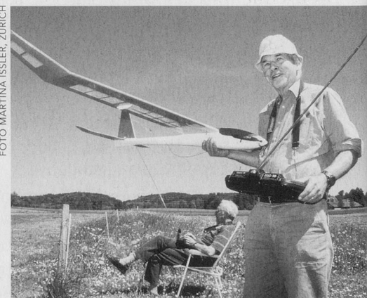
Pläne schmieden ...

man am Morgen gerne aufsteht und abends mit gutem Gefühl ins Bett geht, und wenn man überdies glaubt, dass man aus den Torheiten der Jugend etwas gelernt und ein wenig Weisheit