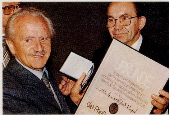
Anerkennung der Verdienste um die Naturheilkunde – Alfred Vogel bei der Übergabe der Priessnitz-Medaille 1982.

Der Ruhm holte den stets bescheidenen Alfred Vogel schliesslich ein. In Anerkennung seiner Verdienste um die Naturheilkunde erhielt er 1982 die Priessnitz-Medaille der Deutschen Heilpraktikerschaft, und 1984 wurde er Ehrenmitglied der SAGEM, der Schweizerischen Ärztegesellschaft für Erfahrungsmedizin. 1990 zog sich der 88jährige aus dem Geschäftsleben zurück, um seinen Lebensabend zu geniessen. Was