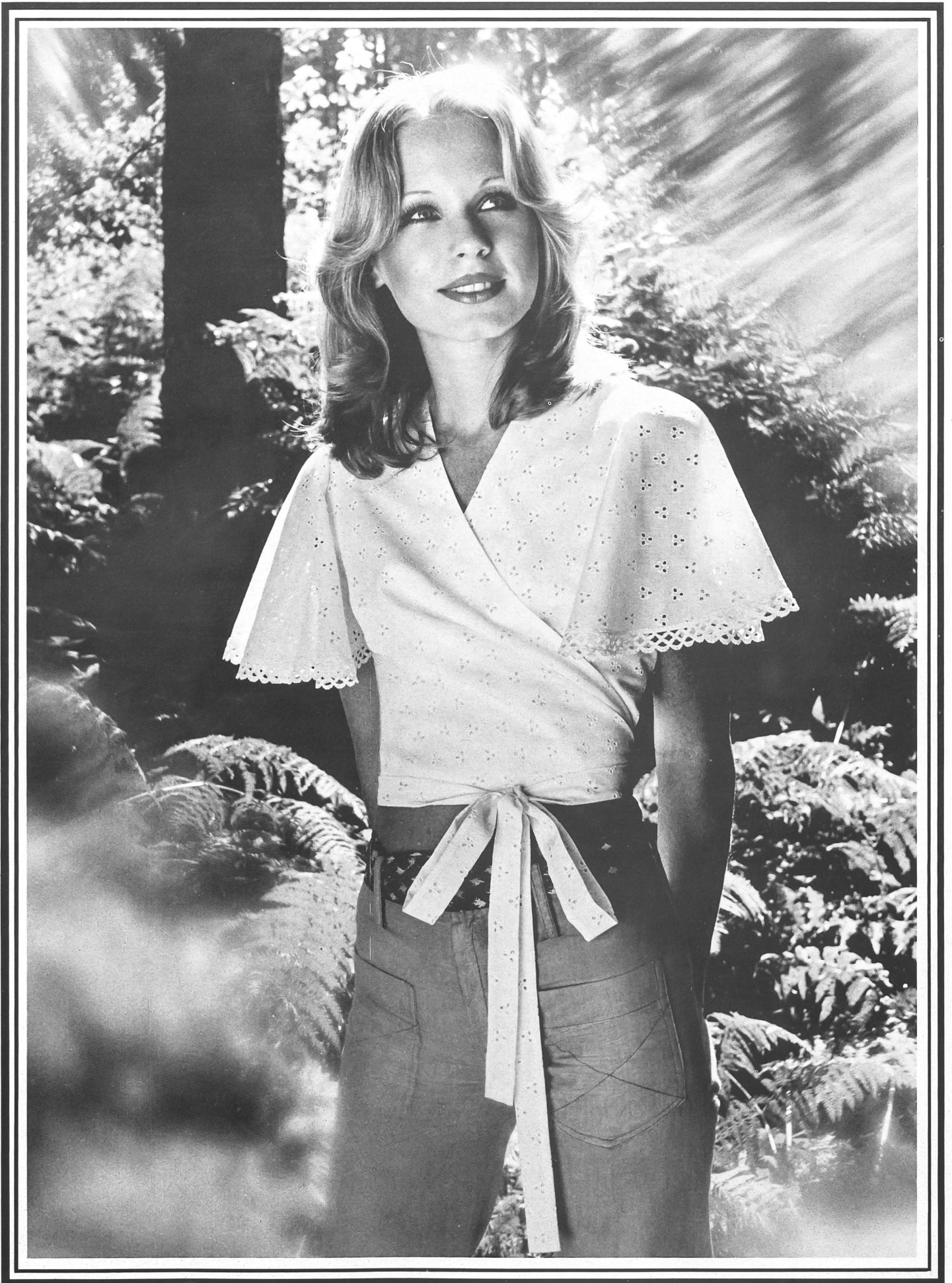
H.W. GIGER AG, FLAWIL Blouse cache-cœur mode en coton brodé.