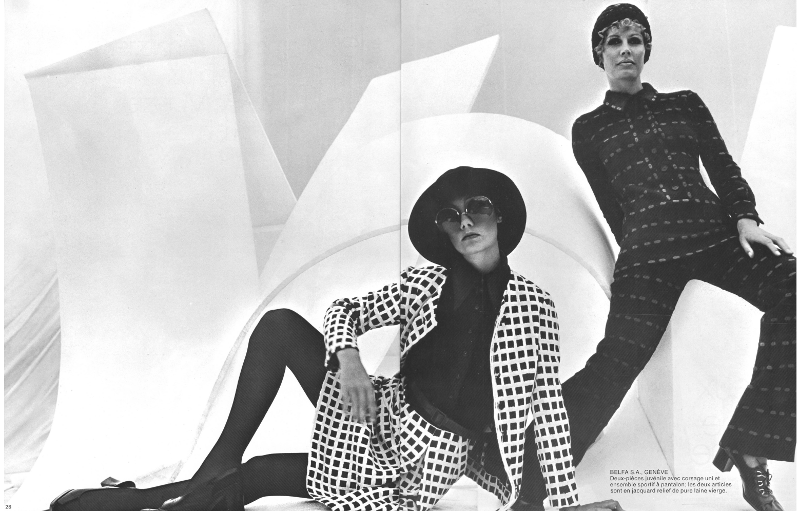
BELFA S.A., GENÈVE Deux-pièces juvénile avec corsage uni et ensemble sportif à pantalon; les deux articles sont en jacquard relief de pure laine vierge.