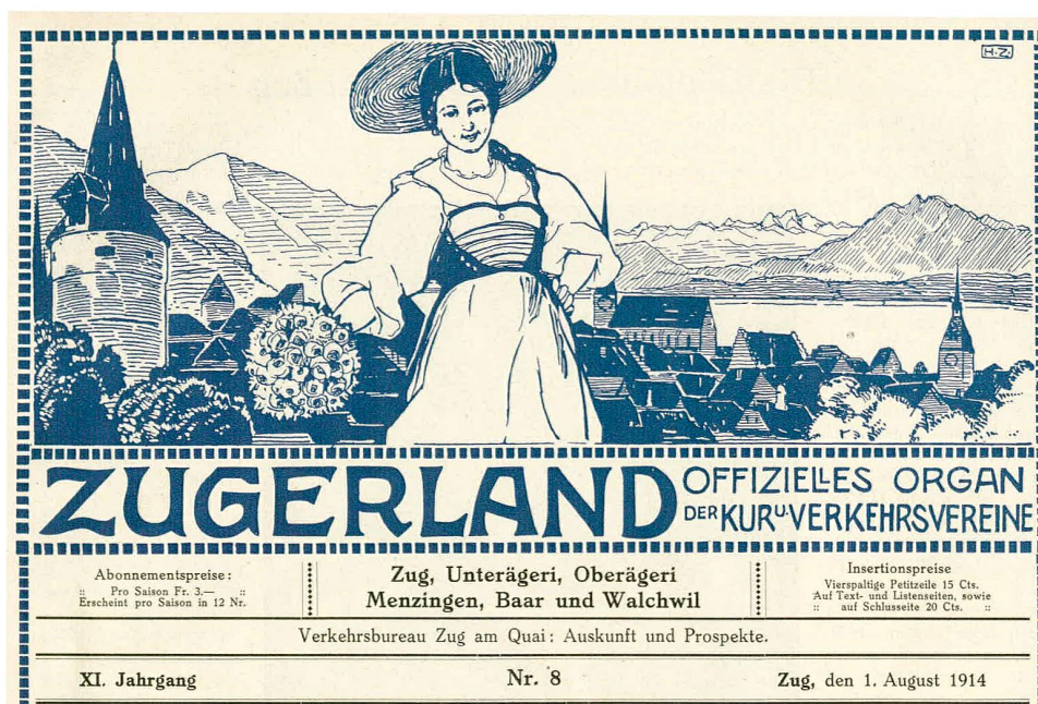
Abb. 3 Die Jahre seit der Jahrhundertwende waren auch im Kanton Zug eine Zeit der touristischen Blüte. Zahlreiche Hotels, besonders in der Stadt Zug und im Ägerital, beherbergten im Sommer ein internationales Publikum, für die das wöchentliche Touristenblatt «Zugerland» Gästelisten, Ausflugstipps und Informationen über Land und Leute bereitstellte. Am 1. August 1914, zwei Tage vor der Mobilmachung, erschien die letzte Nummer.

debattierten über die bevorstehende Volksabstimmung über das Verfahren bei den Kantonsratswahlen. 29