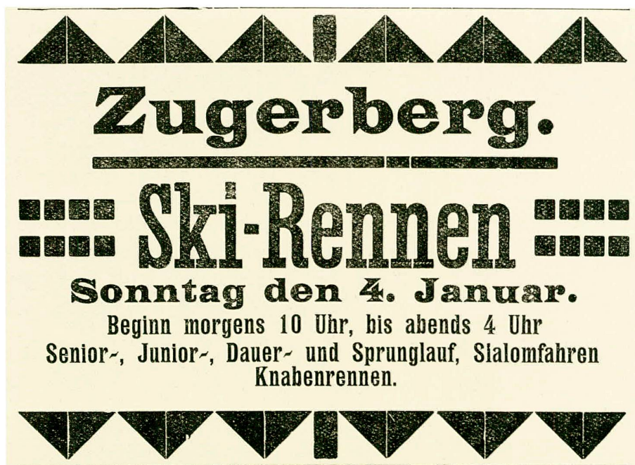
Abb. 1 Erstes kantonales Grosseignis im Jahr 1914 war das Skifest auf dem Zugerberg.

Das neue Jahr 1914 begann winterlich. Es gab viel Schnee, was dem grossen Skifest auf dem Zugerberg am 4. Januar mit Sprunglauf, Dauerlauf, Slalom, Damenrennen und Fassdaubenrennen zum Erfolg verhalf (Abb. 1). Der Wintersport, in Zug zu Beginn der 1890er Jahren von einigen Jünglingen eingeführt und lange Zeit als skurriles Tun einiger Spinner betrachtet, war zum gesellschaftlich akzeptierten Vergnügen geworden, wozu sicher auch die