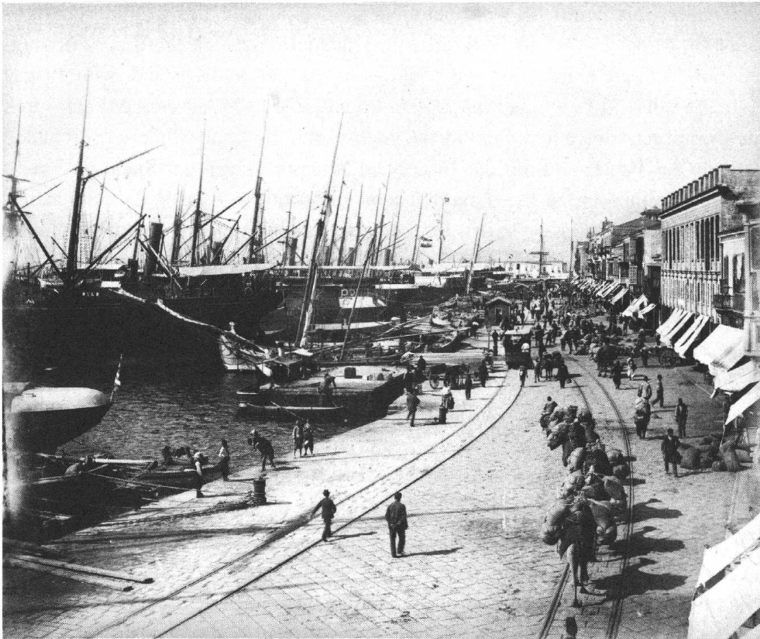
Abb. 3: Beladene Kamele am Kai von Izmir, um 1880–1890.

Kameltreiber auf die Ankunft von Güterzügen warteten, um Fracht ins Landesinnere zu befördern. 29 Während die Eisenbahn von Izmir aus ihre Fangarme über Westanatolien ausstreckte, fanden Kameltreiber ihre Rolle als Zubringer und Verteiler (Abb. 2).