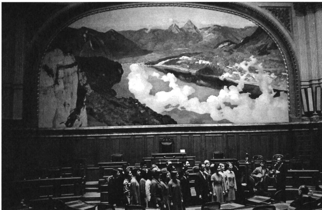
Abb. 3: Photo de la troupe Anything To Declare , 1967 env.

son successeur Song Of Asia (SOA) dans le Jura en 1971, trois ans après qu'ATD a donné des représentations pour les écoles de Bienne 83 et avant que SOA y revienne en 1976? 84 Afin d'optimiser la «conjoncture de réceptivité» du spectacle parmi un nouveau public, 85 les dirigeants anglais et suisses réalisent l'importance, après l'expérience controversée de la représentation trop américanisée de SOD à Zurich, non seulement du procédé nécessaire de traduction – permettant selon Marc Crépon d'éviter l'adhésion à un discours identitaire alarmiste et nationaliste 86 – mais également d'une prise en compte des contextes culturels, historiques et du lien entre les pays responsables de l'import-export du modèle, 87 En plus de nous donner l'occasion d'observer les mécanismes de reconfigurations inhérentes à l'influence d'un modèle étranger que mentionnent Matthieu Gillibert et Pauline Milani, 88 l'épisode des revues musicales RAM illustre la capacité des mouvements conservateurs à réinventer leurs formes de pratiques tout en offrant le même type de discours. Nous assistons ici à une récupération de la figure du révolutionnaire à l'aide de la prise en compte des problèmes de société des années 1960 et de la réappropriation des moyens d'expression en vogue. L'apologie de valeurs traditionnelles et l'adhésion aux principes du RAM sont proposées comme de meilleures alternatives face à la «Nouvelle-Gauche contre-culturelle.» 89