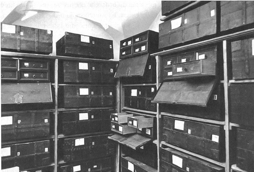
Abb. 1: Die Fluchtkisten von 1730 dienten bis 1978 zur Aufbewahrung der Urkunden.