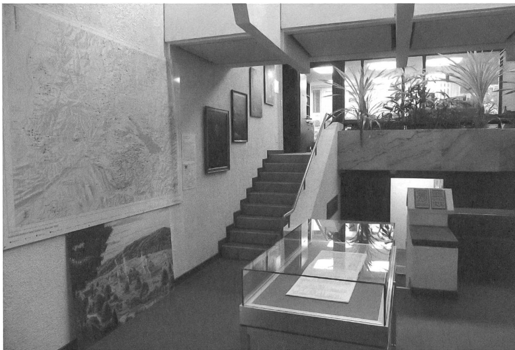
Abb. 4: Das Stiftsarchiv St. Gallen im Nordflügel des St. Galler Regierungsgebäudes, wo das wertvolle Erbe seit 1978 untergebracht ist.