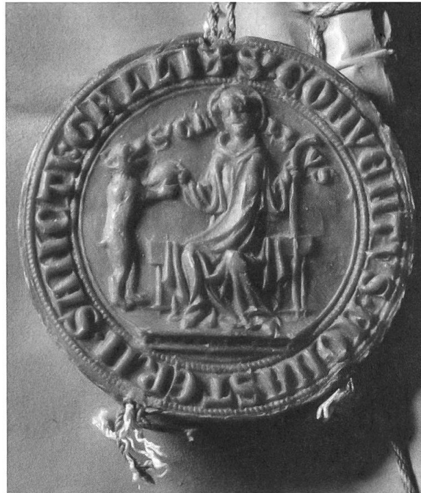
Abb. 3: Das St. Galler Konvent-siegel war in dieser Form seit 1290 in Gebrauch. Abgebildet ist der heilige Gallus mit dem Bären, welcher später zum Wappentier der Stadt St. Gallen wurde.

der theologischen, kirchenrechtlichen und kirchengeschichtlichen Bestände des Stiftsarchivs. Aus agrargeschichtlicher Sicht liesse sich ebenfalls mehr aus den Beständen herausholen; immerhin liegen in St. Gallen die wohl früheste Erwähnung der Dreifelderwirtschaft sowie der älteste schriftliche Nachweis von Alpwirtschaft. Die frühmittelalterlichen Urkunden, Profess- und Verbrüderungsbücher sind auch aus der Sicht der deutschen Philologie von herausragender Bedeutung, da sich in den Originalen des Stiftsarchivs unzählige Beispiele von volkssprachlichen Personen- und Ortsnamen in lateinischer Umschrift wiederfinden. 15