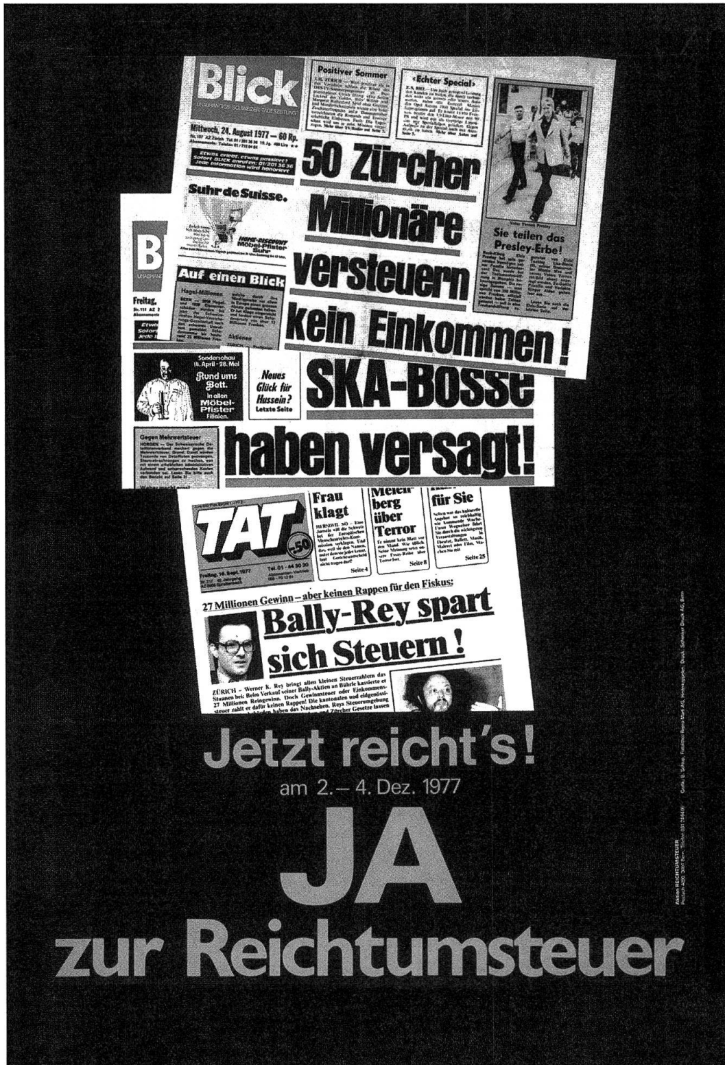
Abb. 1: Plakat der Befürworter der Reichtumssteuer-Initiative, das eine Brücke zu den «steuerfreien Millionären», zum Chiasso-Skandal und zum Fall Bally/Rey schlägt.