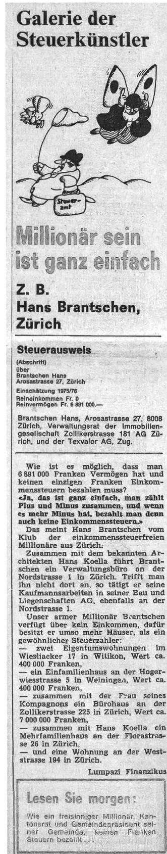
Abb. 4: Artikel der Serie «Galerie der Steuerkünstler» aus dem «Volksrecht» vom 26. November 1977.