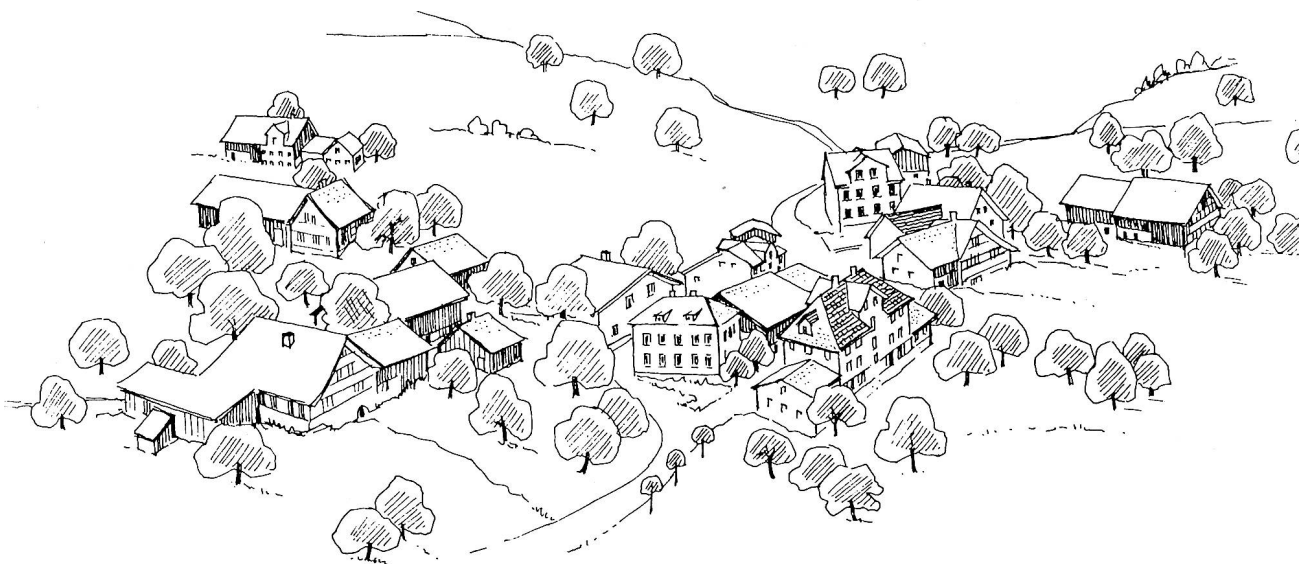
Grämigen um 1905