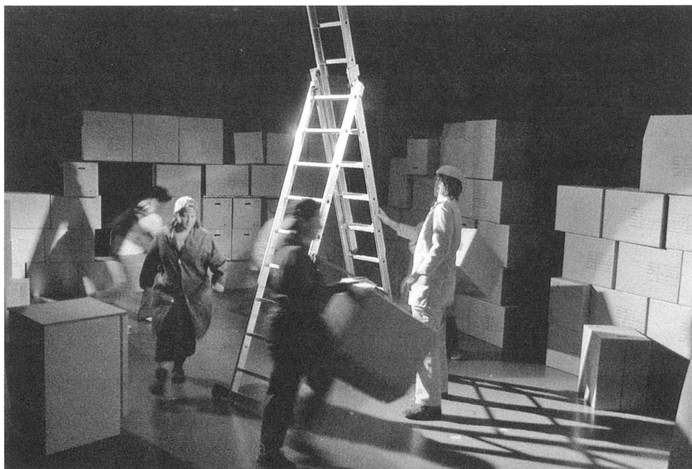
Proben zu «Der Umzug» mit dem Theagovia Theater. Premiere 20. November 2008 im Theaterhaus Thurgau Weinfelden.