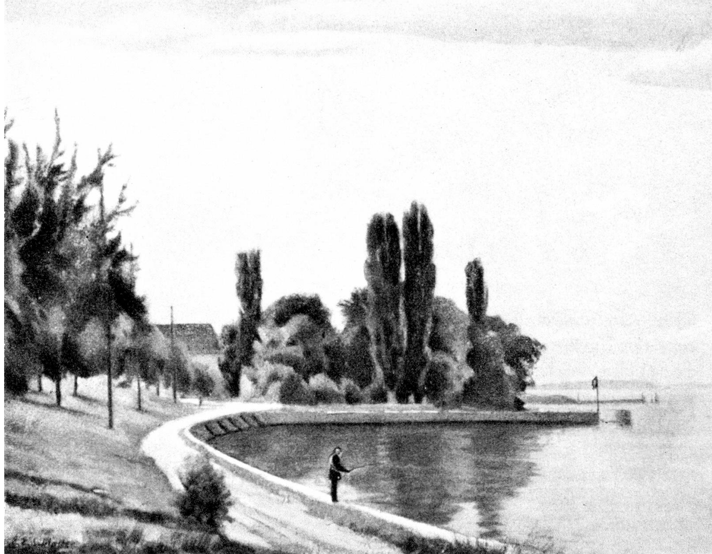
Angler bei Uttwil. Gemälde von Ernst E. Schlatter

unserer erst seit einigen Jahren angewandten Methode: Die Fischerrute wird am Bootsrand festgemacht. Am Ende des Nylonfadens hängt ein Bleigewicht von 250 bis 270 Gramm Gewicht, im Abstand von je etwa 2 Metern folgen vier oder fünf Seitenzügel, bestückt mit einem kleinen Felchenlöffel. Wir nennen diese Montage respektlos «Löligeschirr». Eine Stunde war ich nun schon mit dieser Ausrüstung umhergefahren, hatte verschiedene Tiefen abgefischt, aber die Rutenspitze bewegte sich nicht. Da, eine Kurzsclußhandlung: Ich ließ der Schnur freien Lauf, bis etwa die Hälfte von der Rolle abgelassen war. Eine Nachkontrolle ergab, daß der unterste Löffel sich in einer Tiefe von 25 bis 28 Metern befinden mußte. Erfolg versprach ich mir von meiner Methode nicht. Kretzer mußte es in meinem bezogenen Revier geben, das wußte ich von meinen Sportkameraden. Doch wie erstaunt war ich, als nach kaum einer Viertelstunde die Rute sich langsam nach hinten bog, sich aber bald wieder streckte. Mein erster Gedanke: Sicher hast du einen «Hänger» am Boden mit Glück überstanden. Also fuhr ich etwas seeauswärts, und nun fing