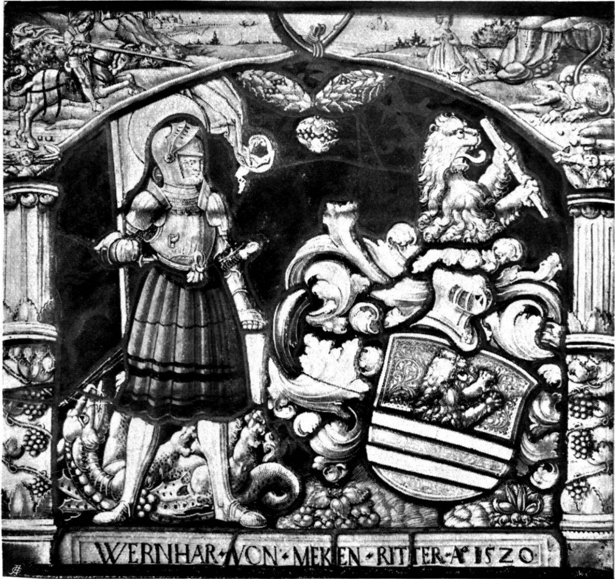
Abb. 10. Wappenscheibe des Ritters Werner von Meggen. 1520. (Vgl. S. 74).