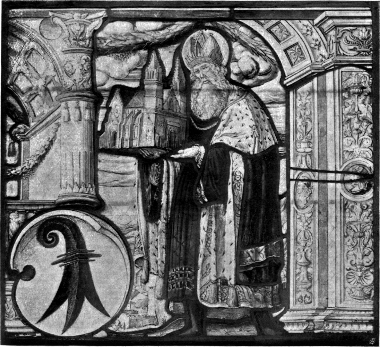
Abb. 12. Standesscheibe von Basel mit Kaiser Heinrich. Von Antony Glaser in Basel. c. 1520. (Vgl. S. 72).