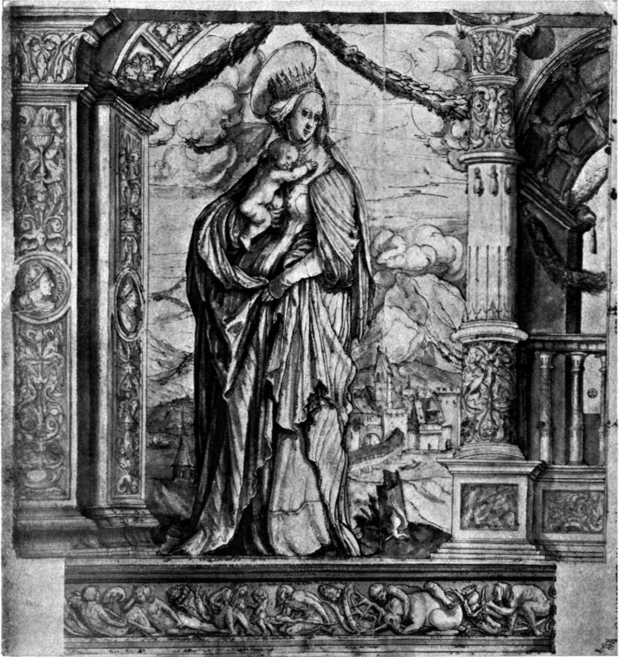
Abb. 13. Entwurf zur linken Hälfte der Standesscheibe von Basel von H. Holbein d. J. (Vgl. S. 72).