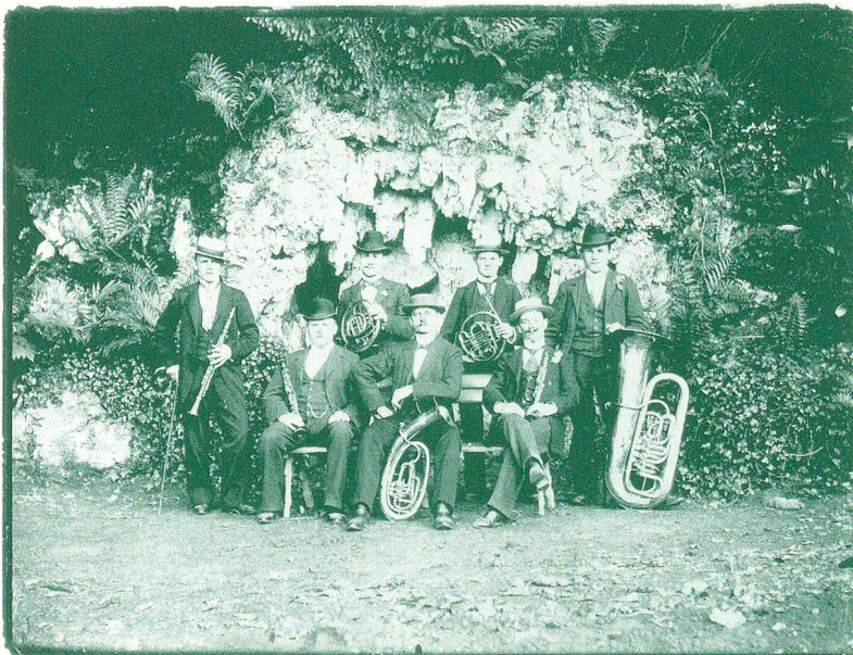
Abb. 5: Die «Grotte Eugénie» am Anfang des 20. Jahrhunderts, als die Anlage schon teilweise zerstört (Brunnenschale) und überwachsen war. Der Aufnahmeort des Fotos konnte erst dank der Grabungen eruiert werden.