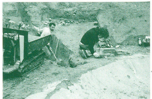
Abb. 2: Archäologen an der Grob- und Feinarbeit. Freilegungsarbeiten am Springbrunnen und der gusseisernen Leitung, die ihn mit Wasser versorgte (Foto: Amt für Archäologie des Kantons Thurgau, Regula Gubler Cornelissen).

Die archäologischen Untersuchungen auf Arenenberg hatten anfangs das Ziel, den Erhaltungszustand einzelner Parkelemente auf der unteren Geländeterrasse festzustellen. Deswegen wurde vor allem mit Sondierschnitten und kleinen flächigen Grabungen gearbeitet (Abb. 2). Im Frühling 2007 wurde dann das Areal unter dem Schuttkegel der 1970er-Jahre flächig freigelegt und es wurden spezifische Fragen – z.B. zur Wassertechnik – mit kleinen Sondierungen untersucht und dokumentiert. Nicht alle Befunde waren von Anfang an klar zu verstehen. Die vielen regen Diskussionen mit dem Team des Napoleonmuseums 6 zeigten, wie wichtig die Zusammenarbeit mit den Historikern ist, um das Landgut als eine Einheit zu verstehen. Viele der auf den Plänen eingezeichneten Bauten und Wege konnten identifiziert und ihre Bau- und Funktionsweise untersucht werden. Bei der Dokumentation der verschiedenen Bauwerke war die Verwendung von modernsten Materialien und Technologien des frühen 19. Jahrhunderts besonders auffallend und