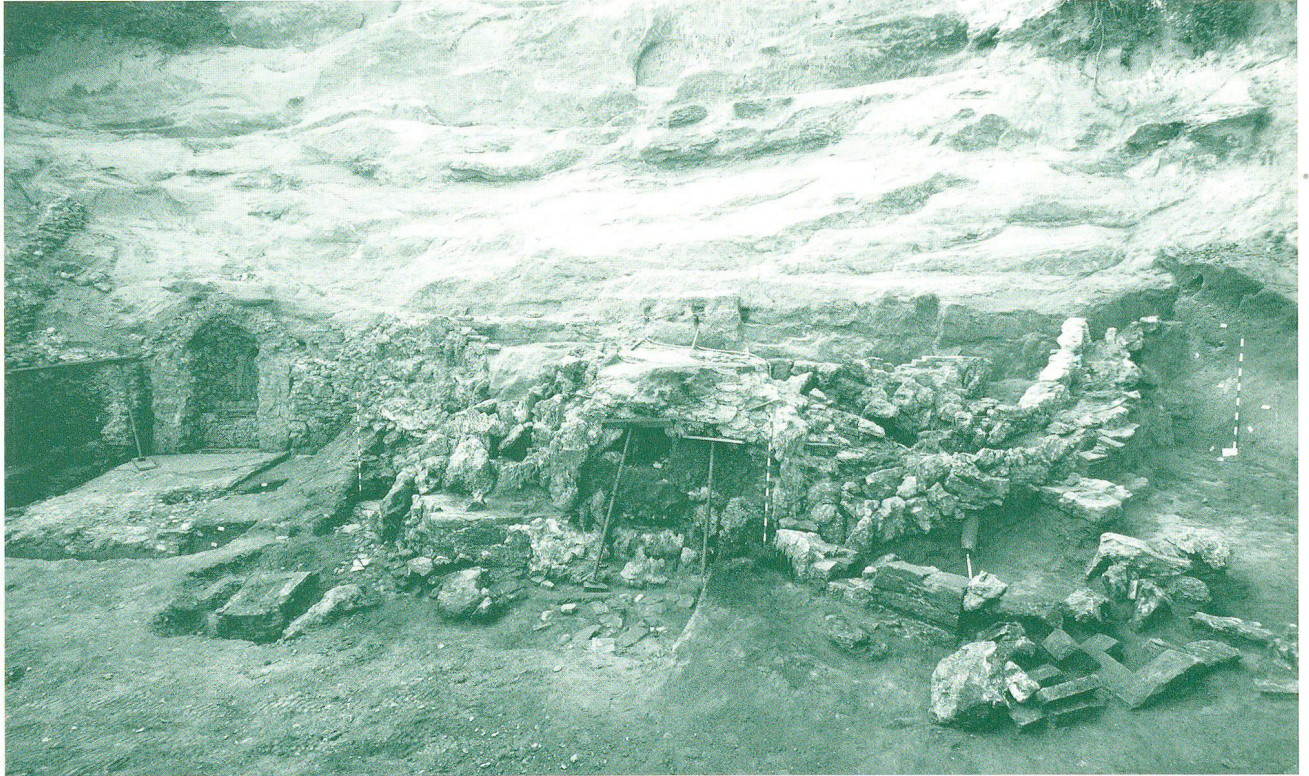
Abb. 4: Übersicht über die ausgegrabene Eremitage (links, Nische mit vorge-lagertem rechteckigem Fundament) und die wasserbespielte Tufflandschaft mit der «Grotte Eugénie» (rechts). Wegen ihres schlechten Erhaltungszustands musste Letztere abgestützt werden. Von der seichten Brunnenschale vor der Grotte waren nur Fragmente erhalten.