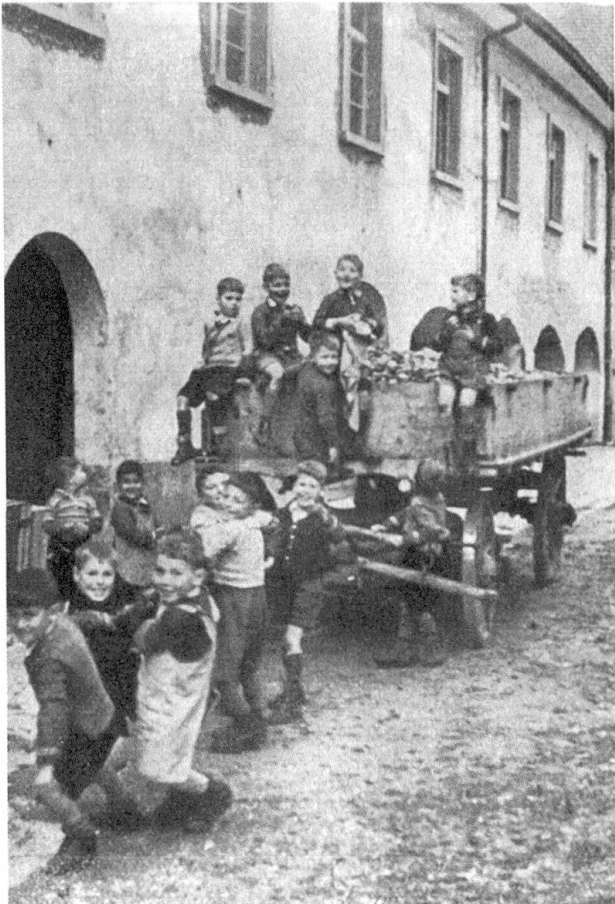
Abb. 14: Jedes Jahr im Herbst führte St. Iddazell im Thurgau eine Apfelsammlung durch, die jeweils von den Kanzeln herunter angekündigt wurde.

sen. 246 Zur finanziellen Rolle der Landwirtschaft lassen sich so kaum Schlüsse ziehen. Von 1920 bis 1936 sind beispielsweise Einkünfte aus dem Landwirtschaftsbetrieb überliefert, die wahrscheinlich die Viehwirtschaft und den Gemüseverkauf betreffen. Aus diesen Zahlen lässt sich schliessen, dass in dieser Zeit die Landwirtschaft einen wichtigen Bestandteil mit bis zu 33,6 Prozent (1920) der Einnahmen ausmachte. 247 Aus den folgenden Jahren sind keine solchen Zahlen überliefert. Die Einkünfte aus den Viehverkäufen hingegen lassen sich eher rekonstruieren. Sie machten bis zu 6 Prozent (1900) des Einkommens der Anstalt aus, 1940 waren es immerhin noch 4,3 Prozent oder rund 2174 Franken.