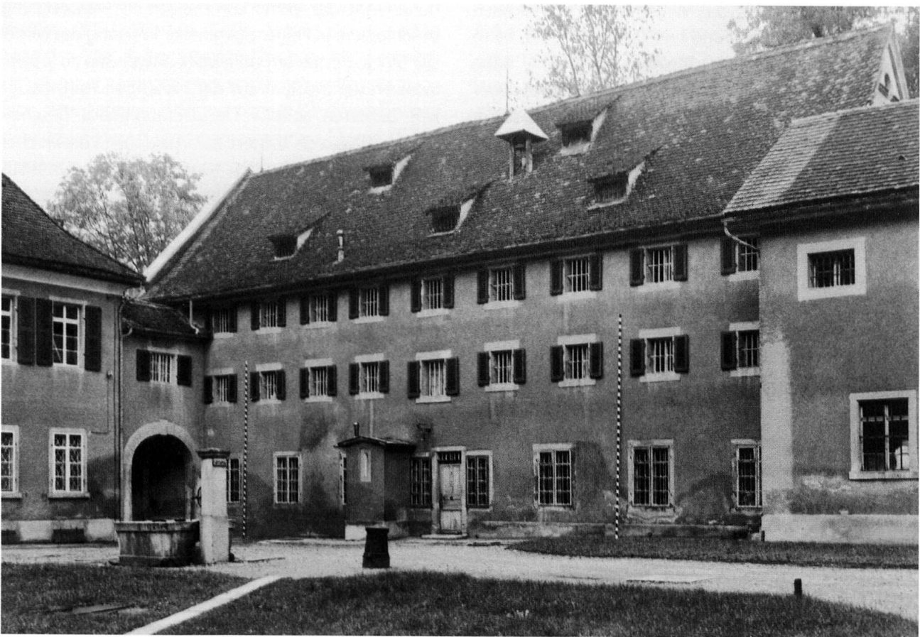
Abb. 2: Die Männerzellen der Strafanstalt Tobel befanden sich im ersten Stock des nördlichen Seitenflügels. Aufnahme von 1964.

einziges Bett gäbe, überlasse er der Besucherin jeweils seinen Platz im Ehebett an der Seite seiner Frau – er selbst übernachtete dann im Stall.