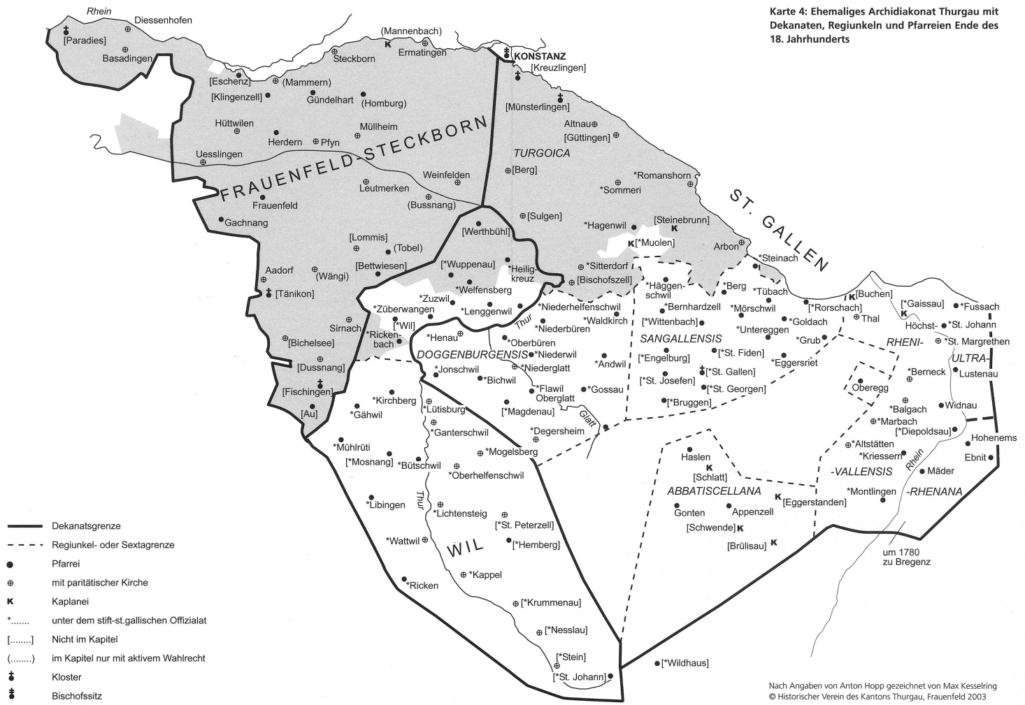
Karte 4: Ehemaliges Archidiakonats Thurgau mit Dekanaten, Regiunkeln und Pfarreien Ende des 18. Jahrhunderts