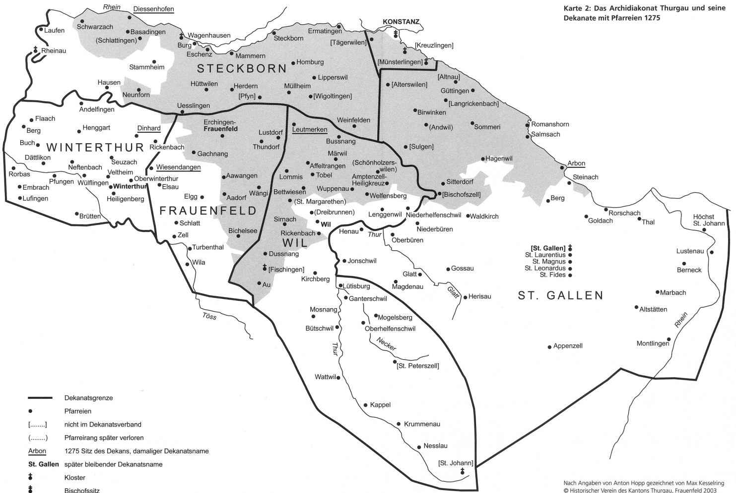
Karte 2: Das Archidiakonat Thurgau und seine Dekanate mit Pfarreien 1275