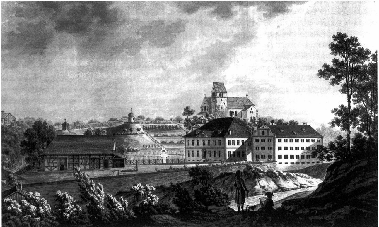
Abb. 2: Komturei Tobel von Nordwesten, um 1807. «Vüe de la Comanderie de Tobel Canton de la Turgovie prèt Frauenfeld possedée par le Prince Philippe d'Hohenlohe Waldenbourg depuis l'an 1767 jusqu'en 1807.»

Anfang 1796: Immer wieder überschreitet Ruckstuhl die st. gallisch-thurgauische Grenze, um seinen Hof zu bebauen und Geschäfte abzuwickeln.