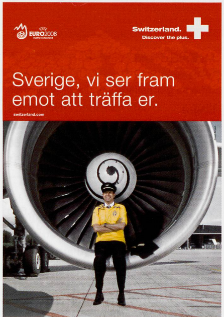
Cartelloni affissi in stazioni ferroviarie e aeroporti. Posters like this are on display in rail stations and airports.

One of the cornerstones of location marketing is the host training initiative, which also includes the education offensive: by the time of EURO 2008, more than 50,000 people will take part in workshops – from frontier guards to service professionals. The charm offensive was launched at the same time: at airports, rail stations and frontier crossings, Swiss people dressed in foreign teams' football shirts are smiling out from posters to show how much they are looking forward to welcoming EURO 2008 visitors.