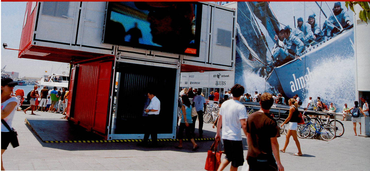
Oltre «Americas' Cup» e «Alinghi»: a Valencia (Spagna) l'«ICON» ha fatto conoscere la Svizzera agli appassionati di vela. More than «Americas' Cup» and «Alinghi»: the «ICON» brought Switzerland closer to sailing fans in Valencia (Spain).