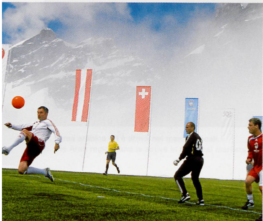
Jungfrauoch, 8 giugno 2007. Jungfrauoch, 8 June 2007.