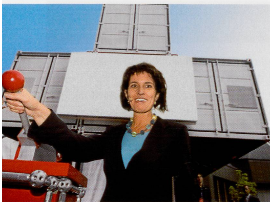
La Consigliera federale Doris Leuthard inaugura il «Più». Federal Councillor Doris Leuthard opens the «Plus».