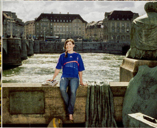
L'operazione simpatia sulle maglie ufficiali delle nazioni partecipanti: in ogni angolo della Svizzera regna una gioiosa attesa delle squadre ospiti e dei loro tifosi. Charm offensive in the team colours of the participating countries: all over Switzerland, people can hardly wait to welcome the guest teams and their fans.