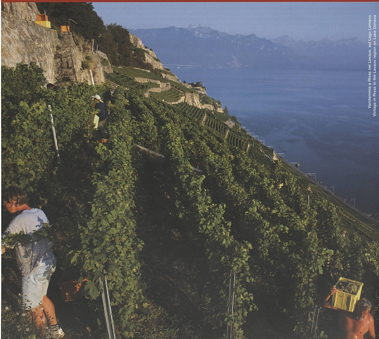
Vendemmia a Rivaz nel Lavaux, sul Lago Lemano Vintage in Rivaz in the Lavaux region on Lake Geneva