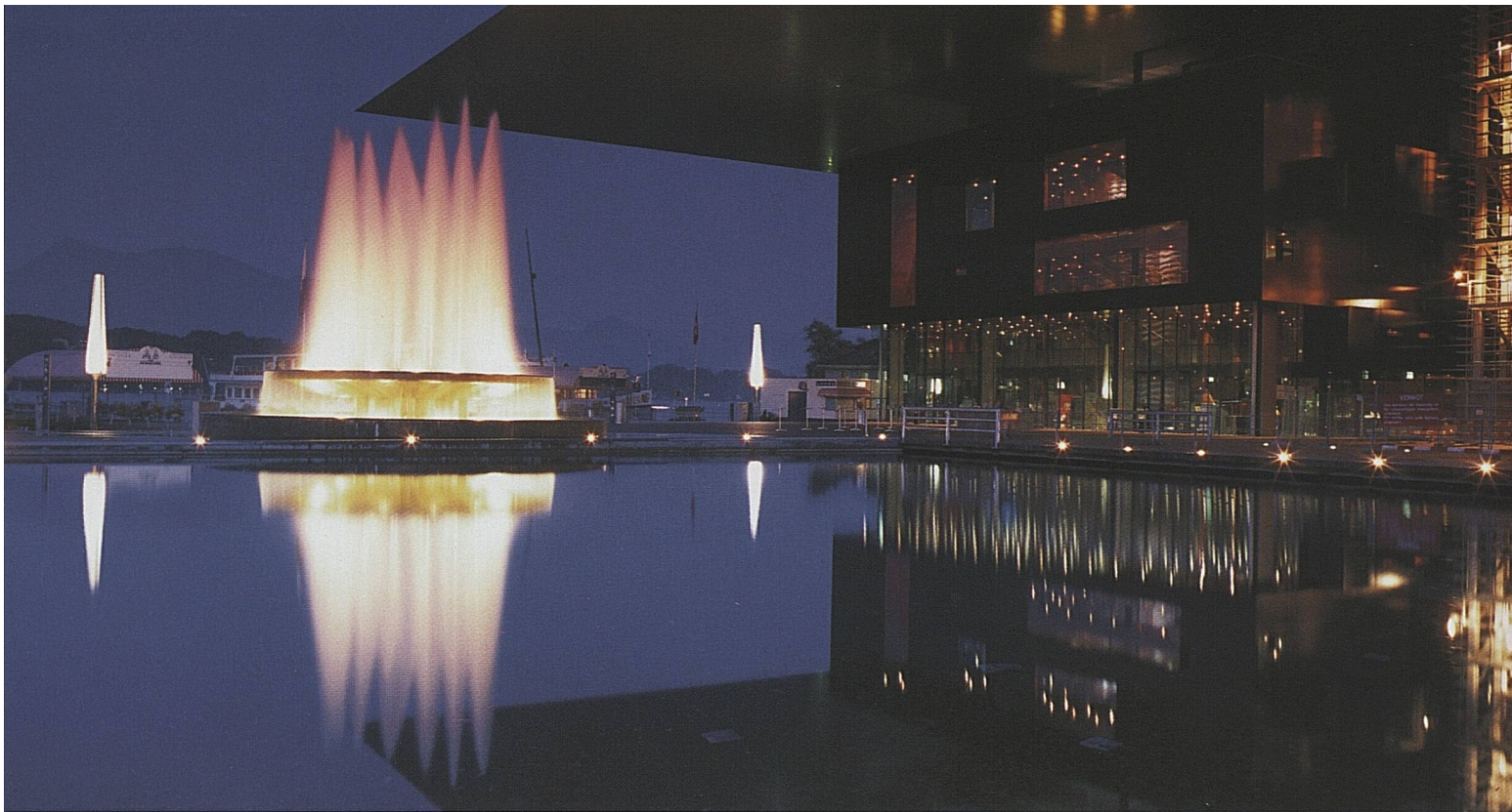
Il sorteggio per le partite UEFA EURO 2008™ si terrà in dicembre al Centro culturale e dei congressi di Lucerna In December, the KKL Luzern (Culture and Convention Centre Lucerne) will host the draw for the UEFA EURO 2008™ football matches