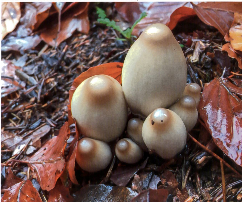
COPRINOPSIS ACUMINATA Fructifications | Fruchtkörper