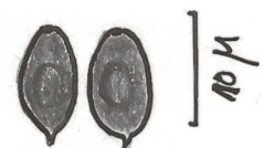
Spores | Sporen