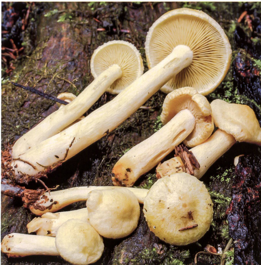
TRICHOLOMOPSIS SULFUREOIDES Fruchtkörper | Fructifications

Spores largement elliptiques à sphériques, lisses, hyalines avec des guttules,