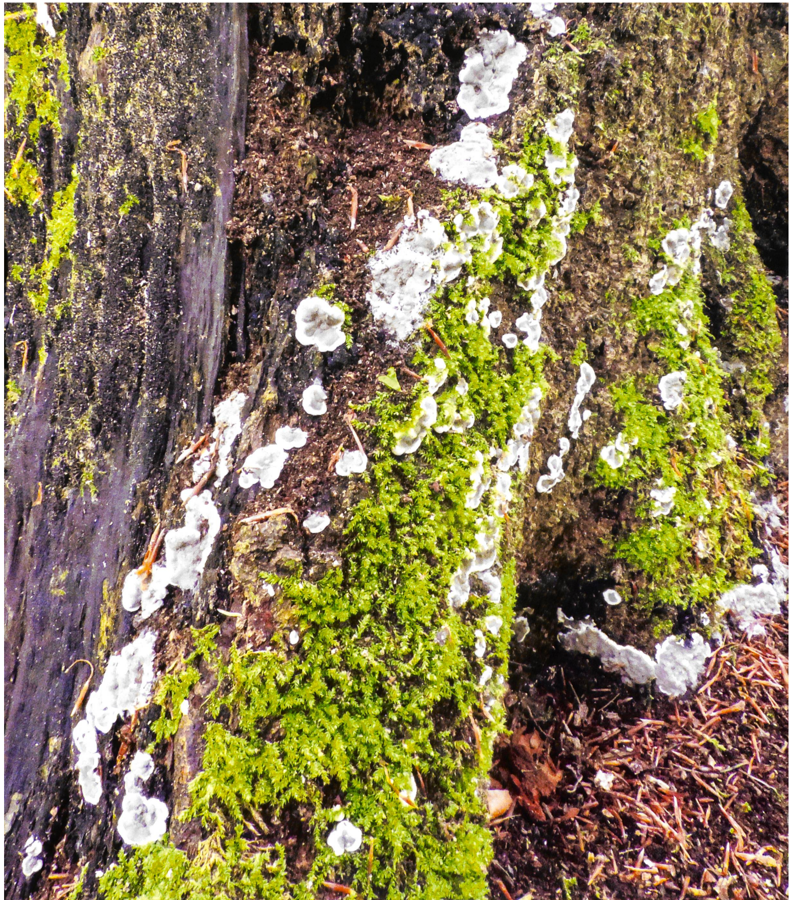
USTULINA DEUSTA Der Brand-Rindenpilz mit seiner stahlgrauen Farbe | Une espèce lignicole